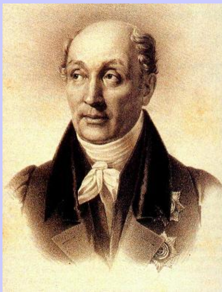
М.М. Сперанский в 1812 г.

В 1810г. был создан Гос. Совет, который должен был рассматривать все законопроекты и рассматривать отчеты министерств. Сперанский был назначен госсекретерем.