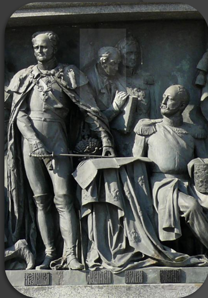
М. М. Сперанский на Памятнике «1000-летие России» в Великом Новгороде

6 августа 1809 года - чины коллежского асессора и статского советника даются не по выслуге лет, как прежде, а только после предъявления университетского диплома или сдачи экзамена по специальной программе.