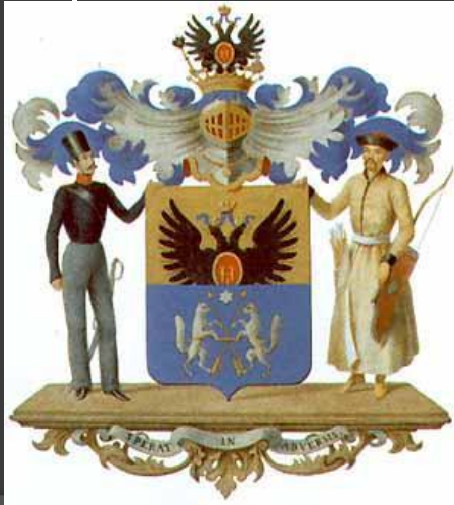
Герб рода Сперанских

Домашнее задание: § 3 , вопросы и задания устно, подготовиться к мини-тесту.