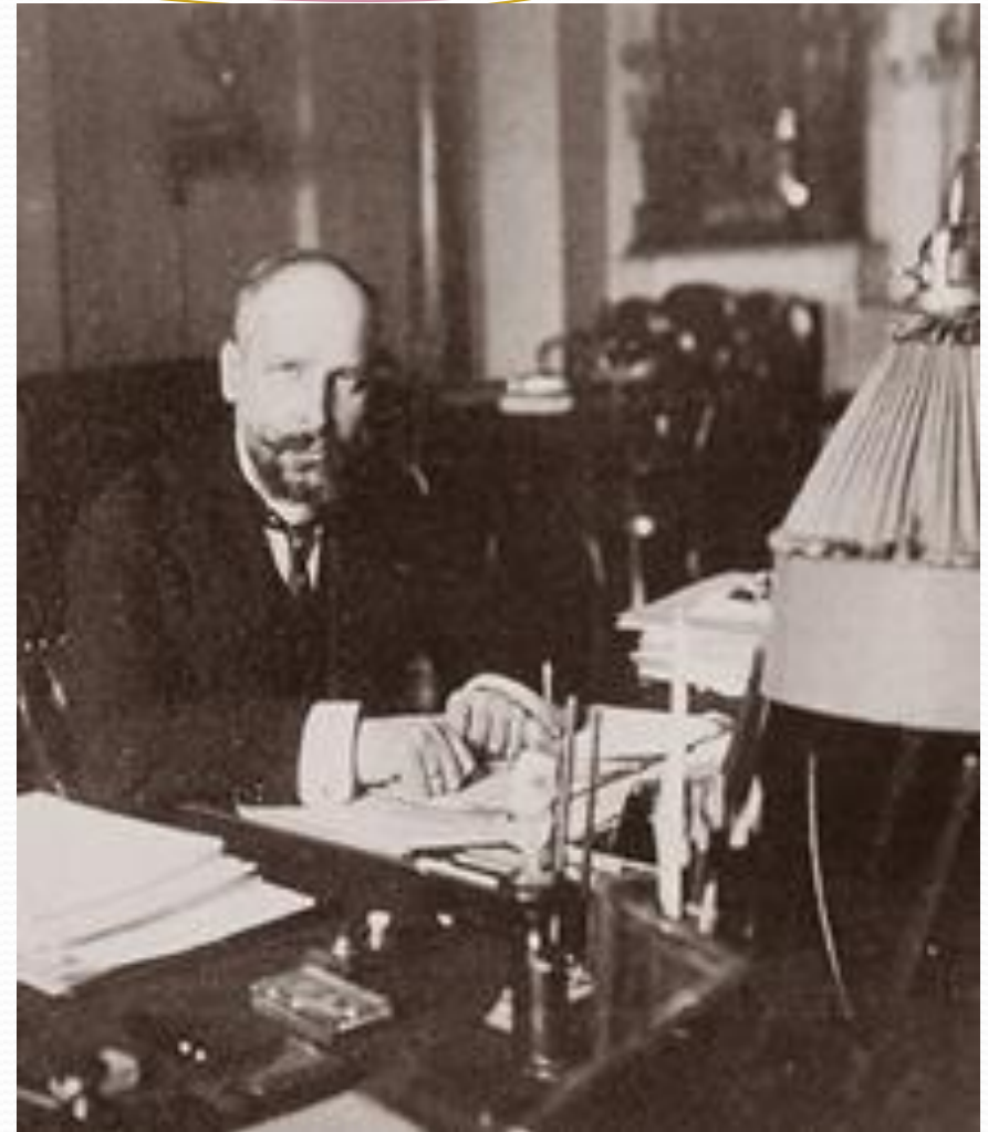
Одна из последних фотографий Столыпина. 1911 г.

Открытие памятника покойному председателю Совета Министров П. А. Столыпину, в г. Киеве, 2 сентября с. г. Памятник высотой 12 аршин. Пьедестал стальной, из светло-серого гранита. По сторонам пьедестала аллегорические фигуры Мещи (русской мещины) и Селян (русских крестьян). Памятник воздвигнут на главной улице Киева, Крещатке, против здания городской думы. Все сооружение обошлось в 120 тыс. руб. На открытии памятника съезжались министры, члены Гос. Совета и Гос. Думы, различные политические фракции, многочисленные депутаты и высшие должностные. Через два дня, 7 сентября, состоялась закладка церкви в г. Столыпинъ Киевск. губ. в память ученической работы П. А. Столыпина.