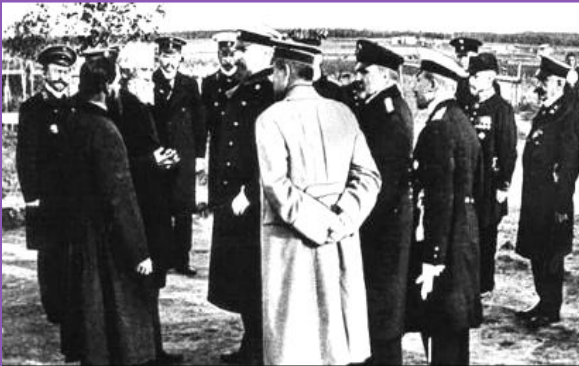
П. А. Столыпин в гостях у кулака.