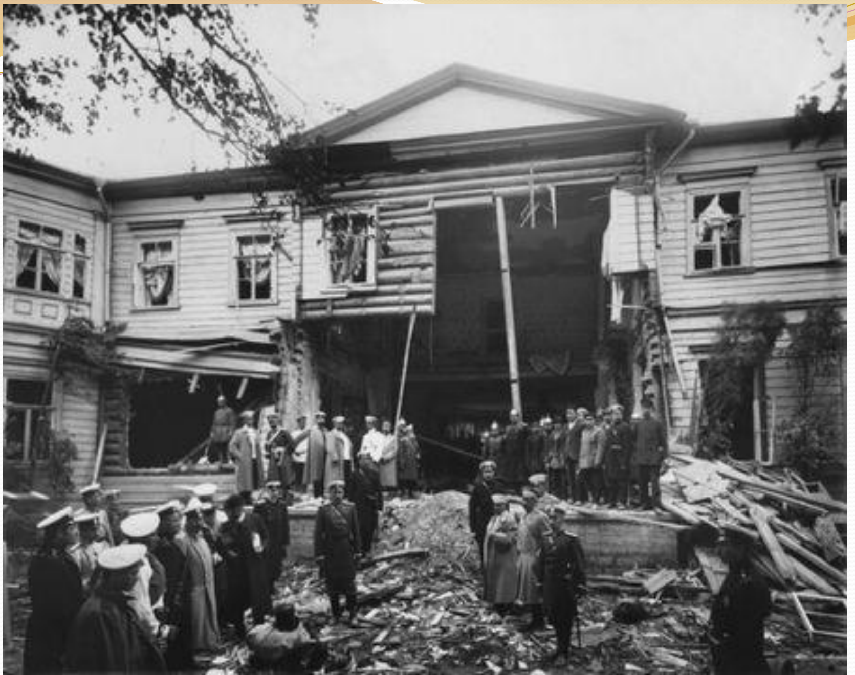
Дача Столыпина после взрыва. Август 1906 г.