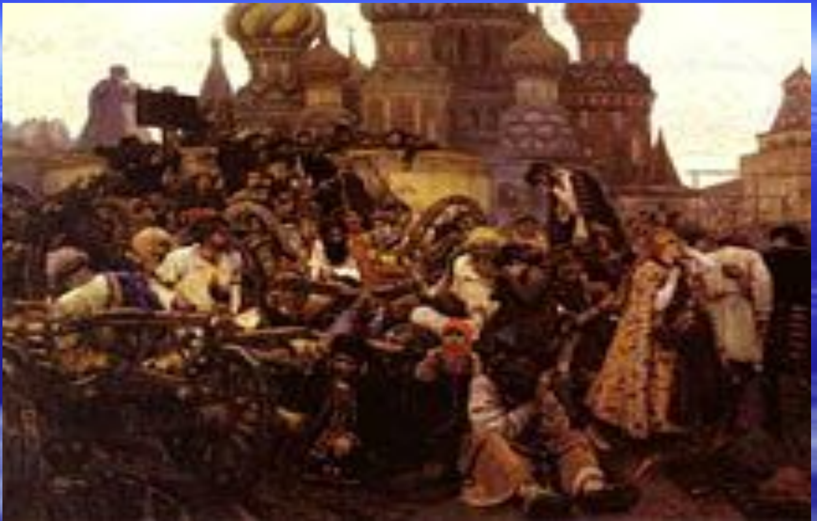
«Утро стрелецкой казни» художник В. Суриков