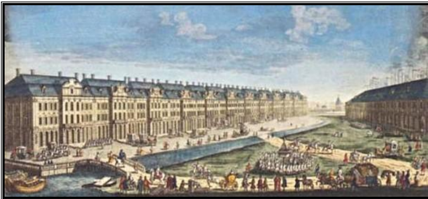
Здание 12 коллегий в Санкт-Петербурге

Стр. 33-35. Читаем. Что изменилось в системе государственного управления?