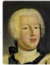
Anton Ulrich v. Braunschweig