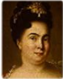
Katharina I 1725-1727