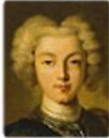
Peter II. 1727-1730