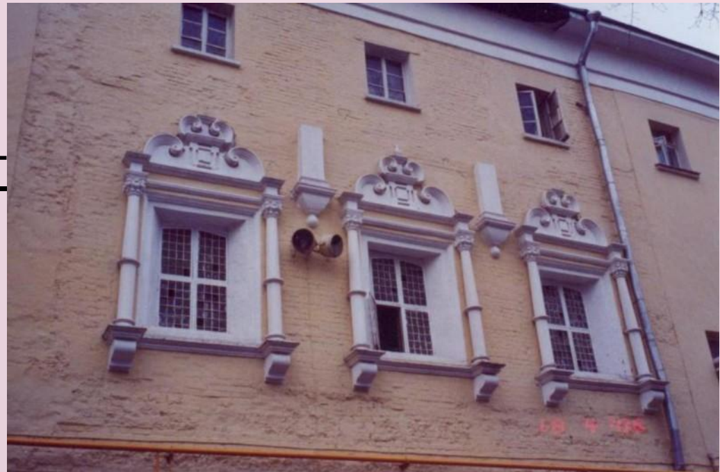
Гимназия пастора Глюка