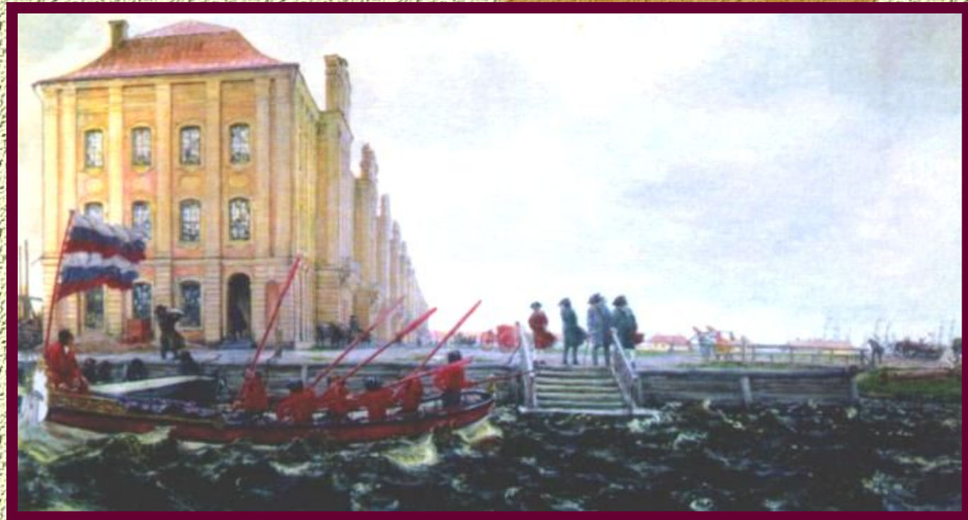
Здание 12 коллегий