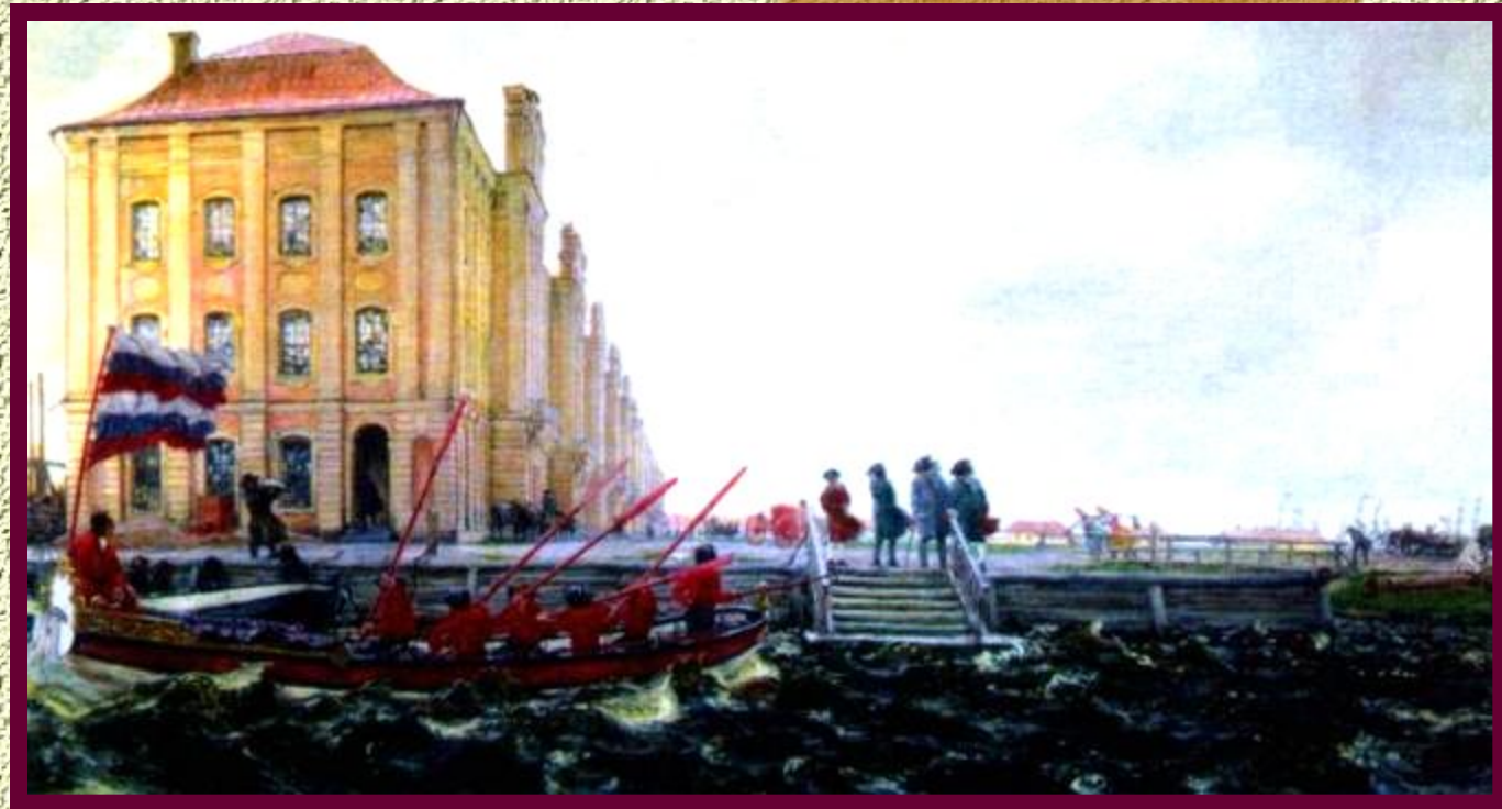
Здание 12 коллегий