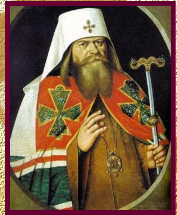
Патриарх Андриан (копия парсуны XVII века)