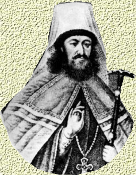
Стефан Яворский – местоблюститель с 1700 г.

Создание Святейшего Синода, контролируемого обер-прокурором, как «ока государева и стряпчего о делах государственных в Синоде»