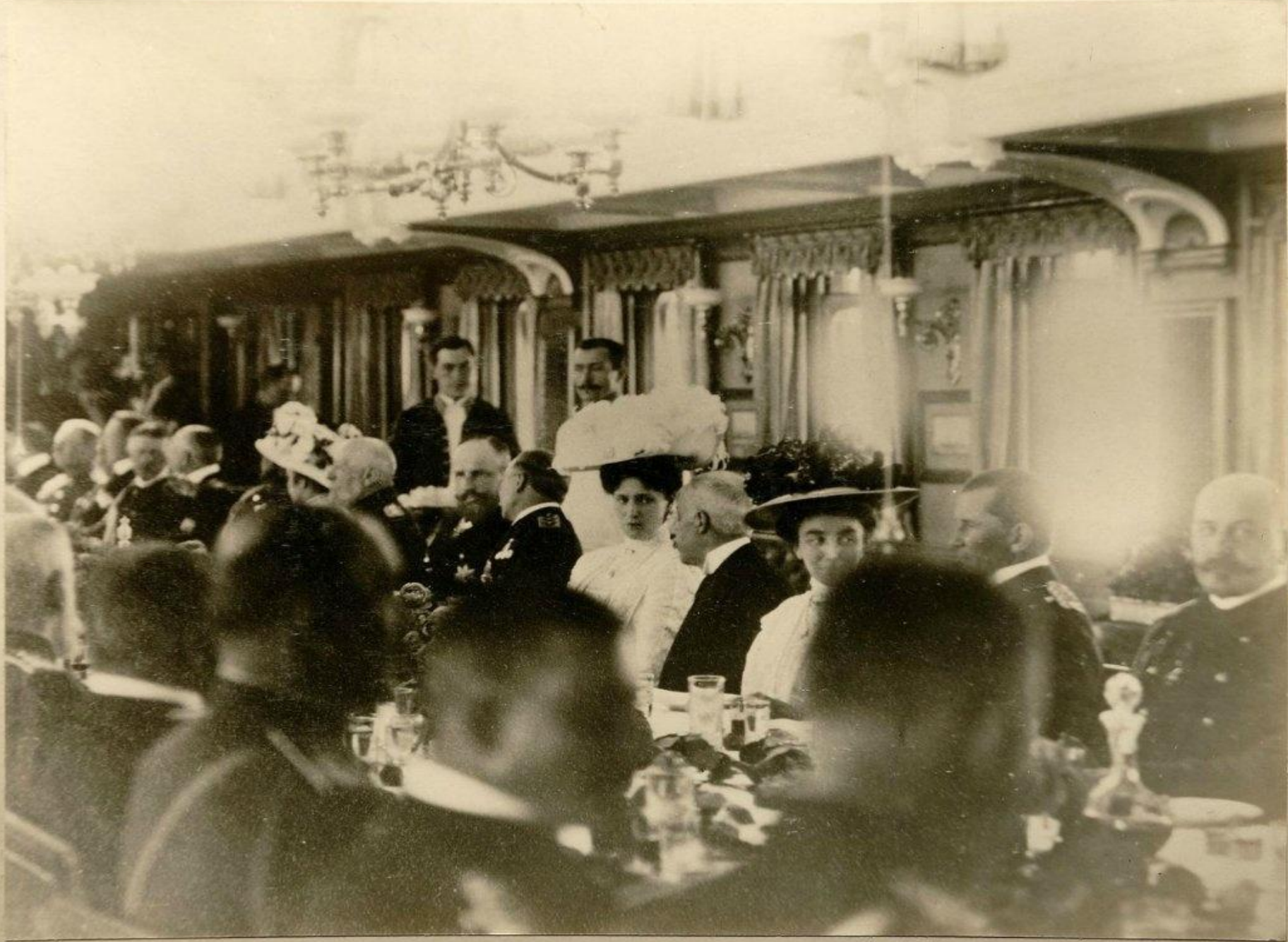
П. А. Столыпинъ на Высочайшемъ завтракѣ на „Штандартъ“, въ финляндскихъ шхерахъ, разговариваетъ съ Германскимъ Императоромъ Вильгельмомъ II, сидѣвшимъ на правой сторонѣ отъ Государыни Императрицы, 4 Юня 1909 г.