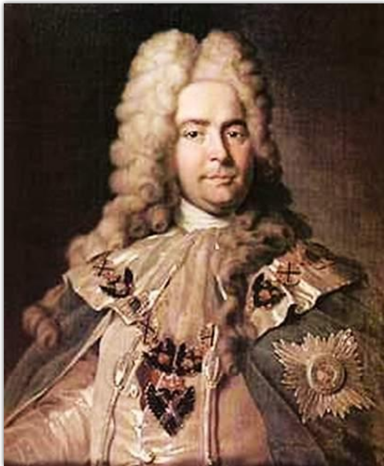
ПАВЕЛ ИВАНОВИЧ ЯГУЖИНСКИЙ

Одновременно с Сенатом появилась должность фискалов . Обязанность обер-фискала при Сенате и фискалов в провинциях состояла в негласном надзоре за деятельностью учреждений: выявляли случаи нарушения указов и злоупотреблений и доносили Сенату и царю. С 1722 года контроль над Сенатом осуществляют генерал-прокурор и обер-прокурор, которым подчинялись прокуроры всех других учреждений.