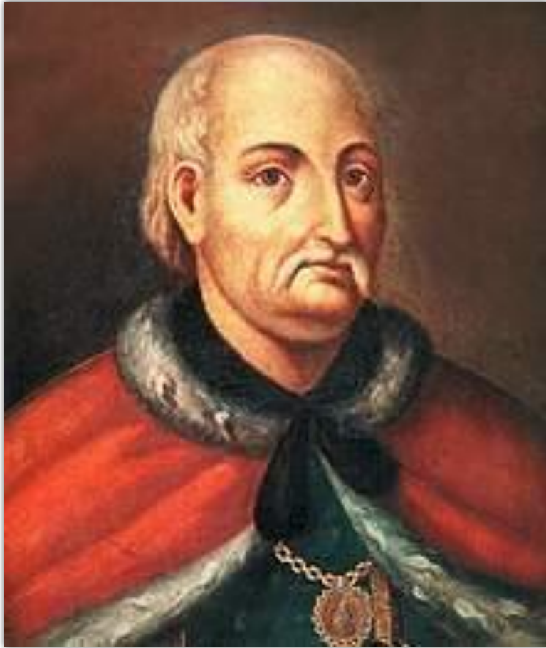
ИВАН ИЛЬИЧ СКОРОПАДСКИЙ

Особый режим местного самоуправления существовал на Украине: