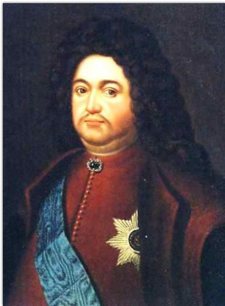
БОЯРИН ТИХОН НИКИТИЧ СТРЕШНЕВ

В состав Сената царь назначил 9 человек боярской знати и своих выдвигенцев. Решения принимались коллегиально. Он превратился в постоянно действующее высшее правительственное учреждение, что было закреплено Указом 1722 года : ▪ контролировал правосудие, ▪ ведал торговлей, ▪ сборами и расходами государства, ▪ наблюдал за исправностью отбывания дворянами воинской повинности.