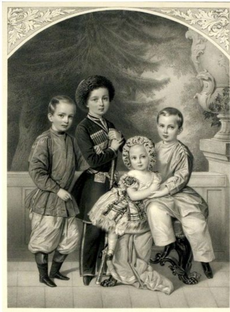
Шевалье, Ф. Портрет великих князей Николая, Владимира, Александра и Алексея Александровичей: [Эстамп]. - 1 л.: Литография; 37x27,7; 63x48,4 см. Источник