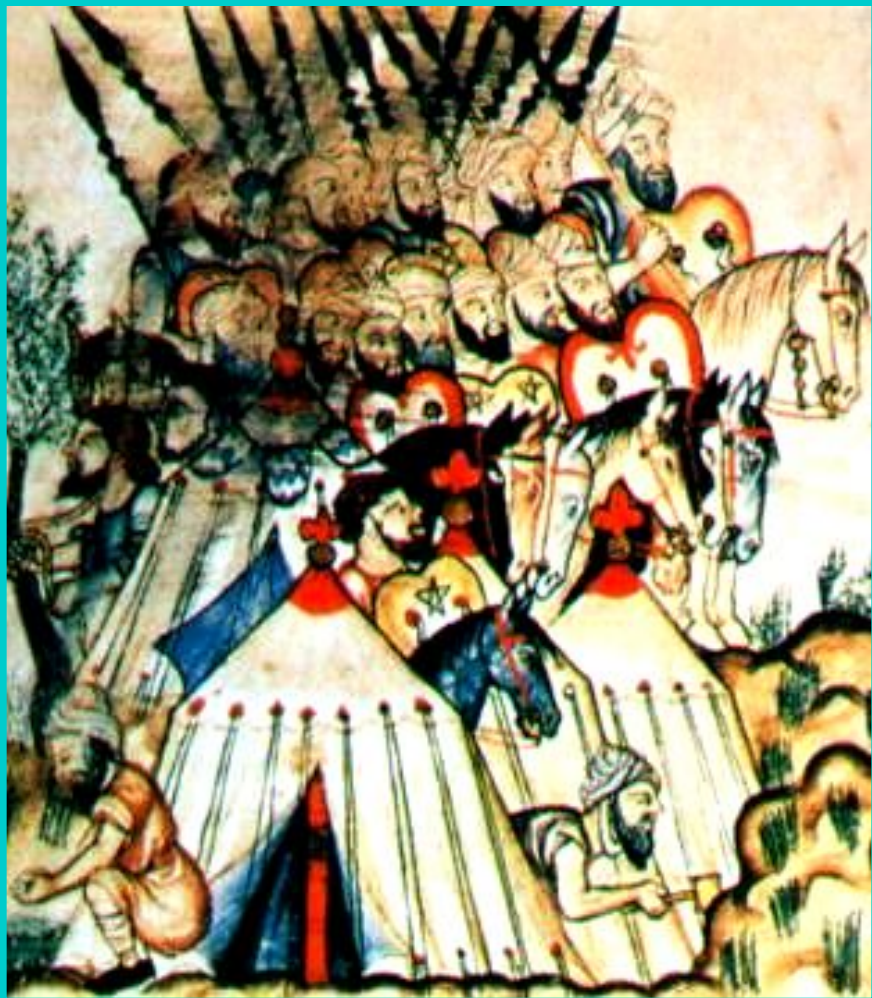
Войско мавров. Средневековая миниатюра.

Испанцев поддержали итальянцы и французы.