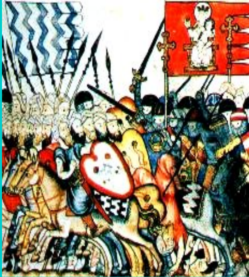
Войско Альфонса X Мудрого в походе. Средневековая миниатюра.

В 10 в в Испании началась Реконкиста -отвоевание земель захваченных му- сульманами.