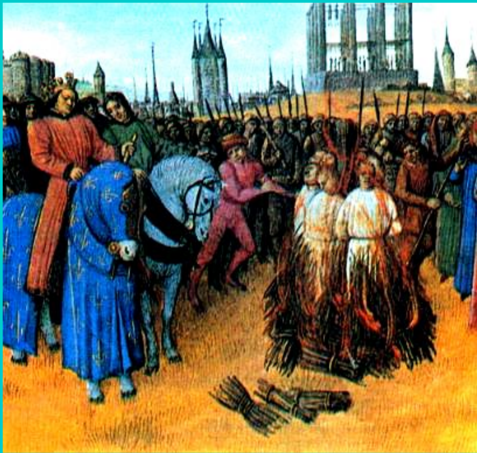
Сожжение еретиков. Средневековая миниатюра.

За 10 лет его «великого инквизиторства» на кострах сгорели 10 000 людей.