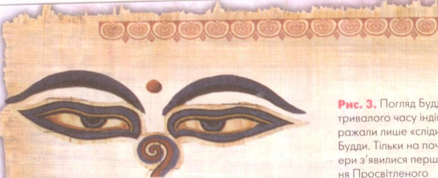
Рис. 3. Погляд Будди. Протягом тривалого часу індійці зображали лише «сліди» й «очі» Будди. Тільки на початку нашої ери з'явилися перші зображення Просвітленого