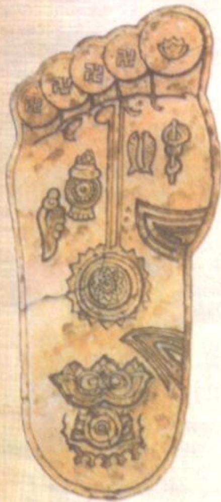
Рис. 4. Слід ноги Будди