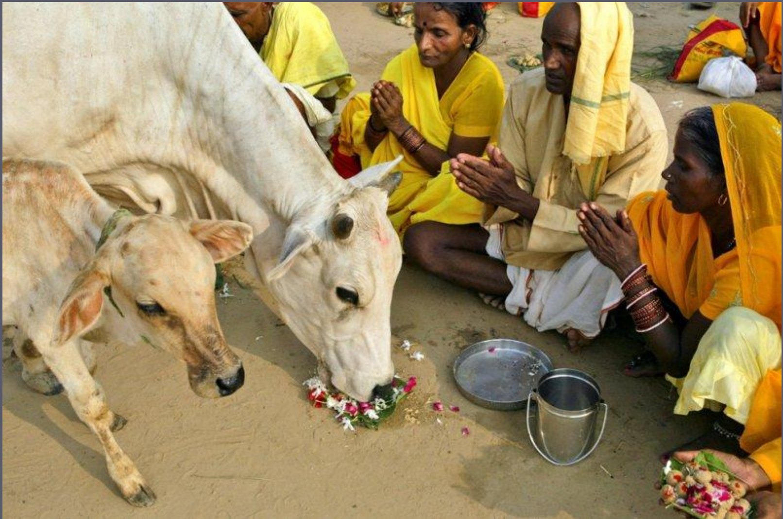
Обряд почитания священного животного