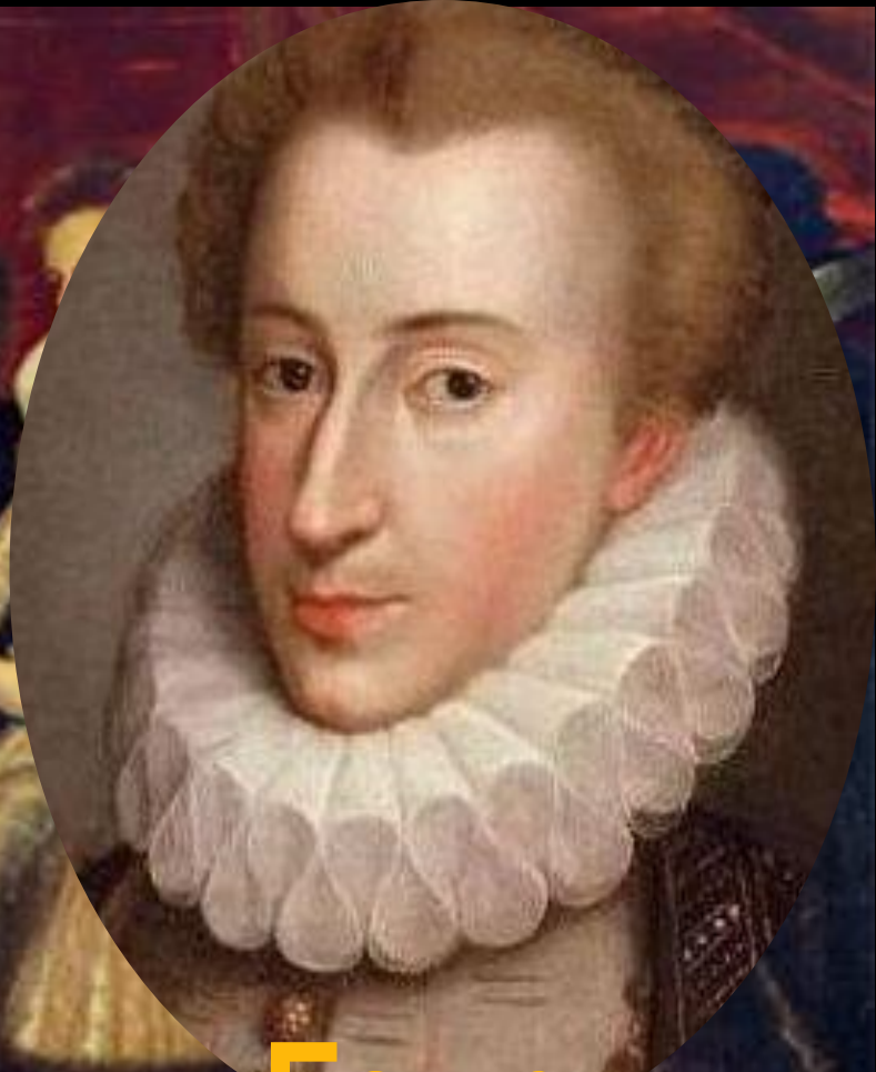
Генрих Бурбон Наварский