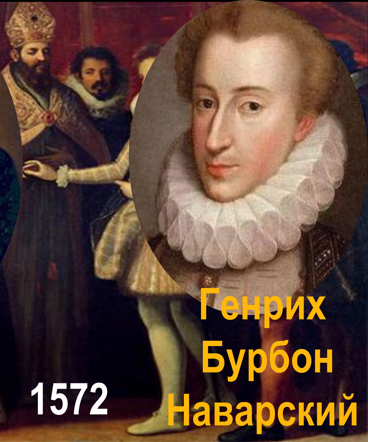
Генрих Бурбон Наварский