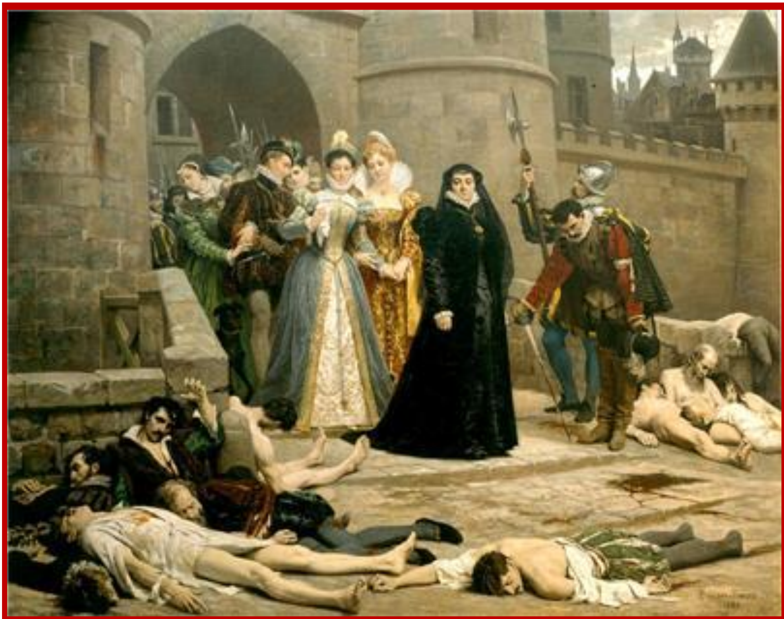
Утро около ворот Лувра. Художник Эдуард Деба-Понсан. 1880 г.