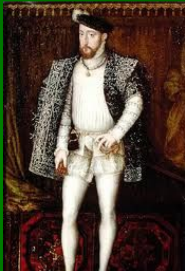
Герцог Генрих де Гиз

Религиозные войны начались во Франции в 1562 году, когда лотарингский герцог Генрих де Гиз, проезжая мимо местечка Васси, напал на отправляющихся религиозную службу гугенотов