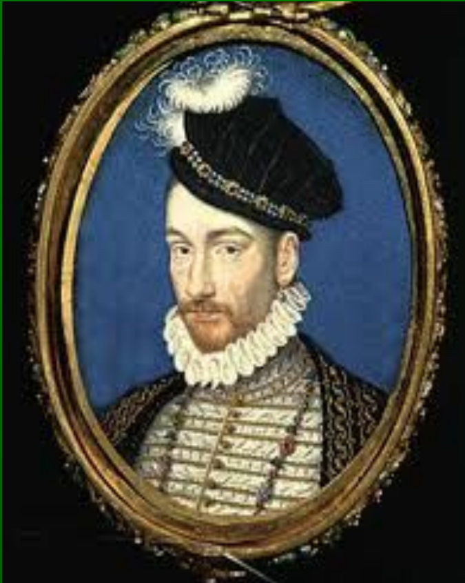
Карл IX - король Франции

Годы правления с 1560- 1574 гг. Проблемы, стоявшие перед Францией, его не интересовали.