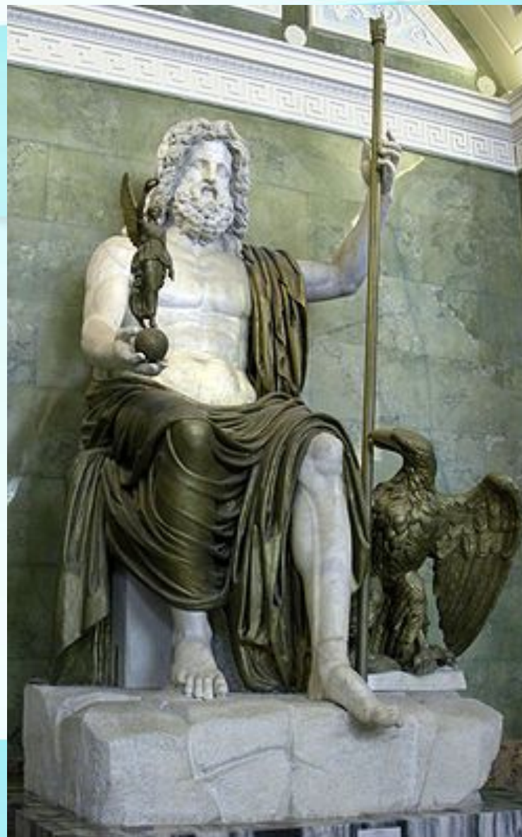
Статуя Зевса в Эрмитаже Бог грома и молнии, верховный бог

– это бог дождя, грома и молний. Лето в Греции засушливое, жаркое, крупных рек нет. Его изображали могучим мужчиной средних лет. Он господствует на небе. Взмахнет Зевс рукой – удары грома раскатятся по небу; сверкнем молния – и хлынут потоки дождя. Один раз в 4 года в Олимпии устраивали Олимпийские игры в честь бога Зевса.