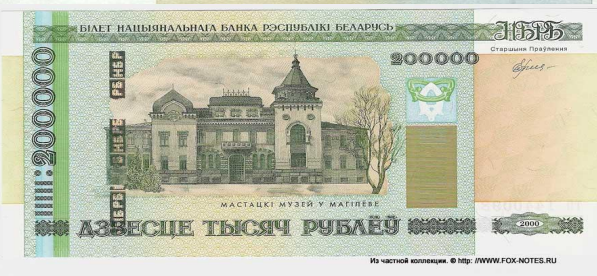
Из частной коллекции. © http://WWW.FOX-NOTES.RU