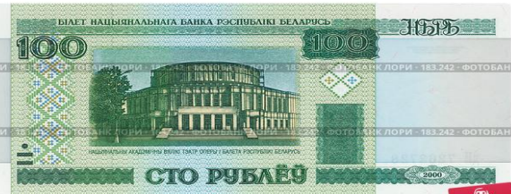
Денги Белоруссии - 100 рублей