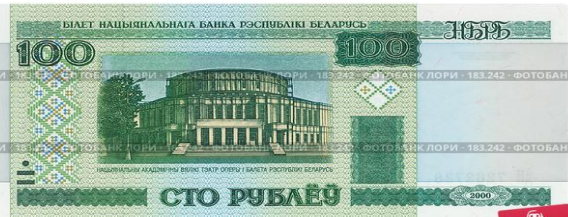
Денги Белоруссии - 100 рублей