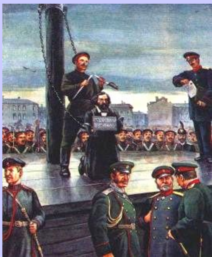
Гражданская казнь Н.Г.Чернышевского

В 1864г. Над ним была совершена гражданская казнь.