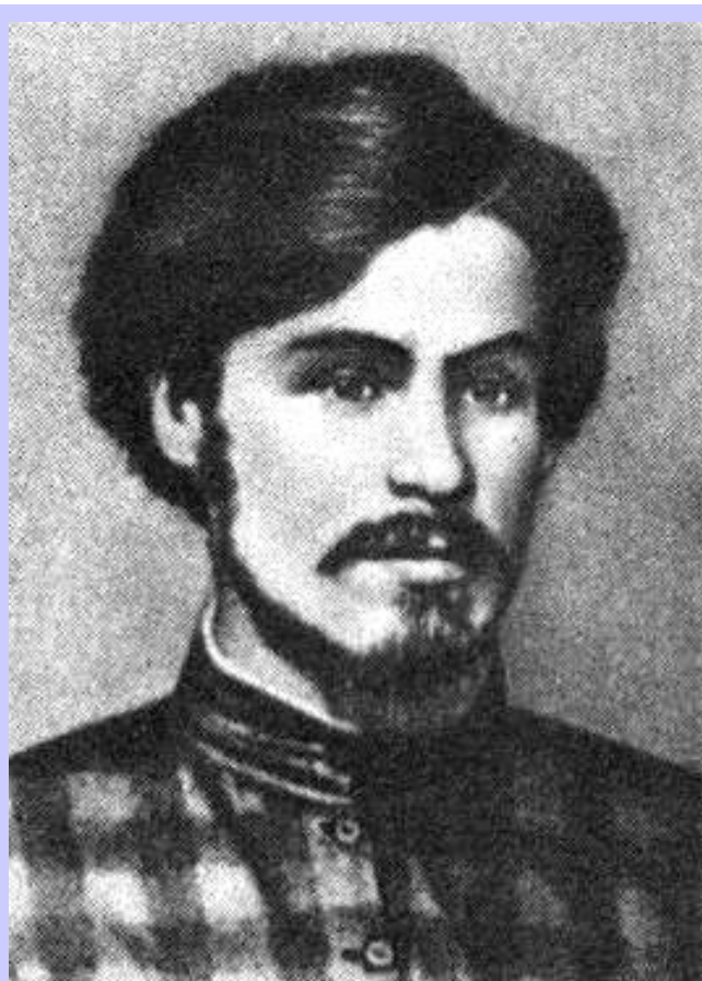
С.Халтурин. Основатель “Северного союза русских рабочих”.