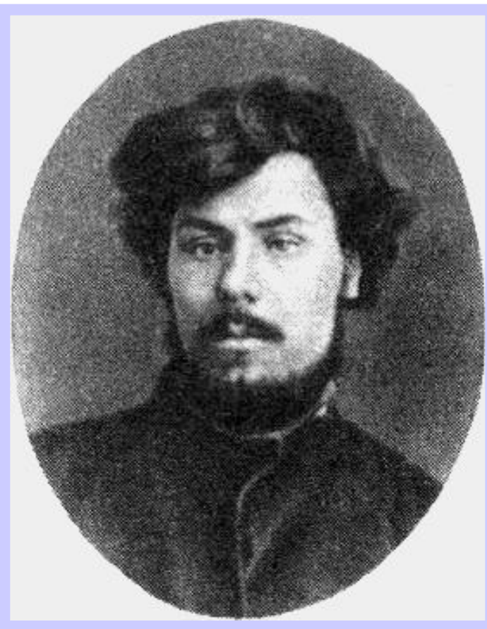
П.Алексеев-1-й русский рабочий-революционер

Народники рассматривали рабочих как выходцев из крестьянства, и налаживали среди них агитационную работу.