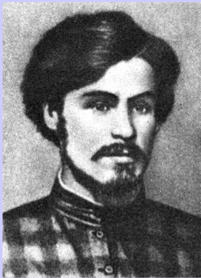
С.Халтурин. Основатель “Северного союза русских рабочих”.