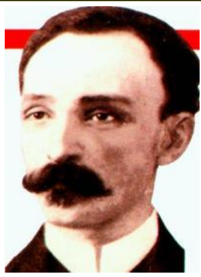
Хосе Марти- национальный герой Кубы

Куба начала борьбу за подлинную независимость от США еще в 30-е. В 1952 г. в результате переворота к власти пришел Ф.Баутиста. 26 июля 1953 г. против диктатуры выступили демократы во главе с Ф.Кастро. Их арестовали и выслали из страны. В декабре 1956 г. Кастро и его товарищи высадились с яхты «Гранма» и начали вооруженную борьбу.