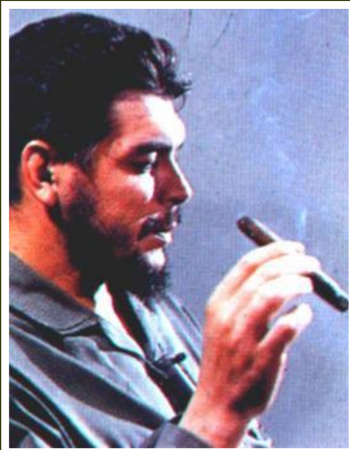
Эрнесто Че Гевара.

Чегевара был выходцем из Аргентины. Несмотря на астму, он много путешествовал и победил болезнь. Увлеченный идеями Ленина, Че познакомился с Кастро и принял активное участие в кубинской революции. Че был сторонником сближения с СССР, но после Карибского кризиса, выступил с идеей втянуть империализм в непосильные для него войны и отправился в Боливию.