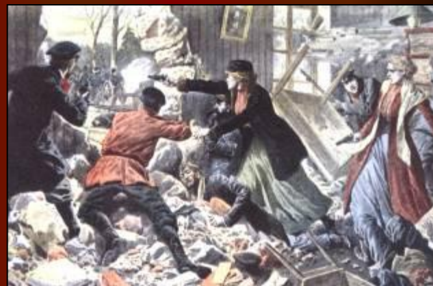
схема "Революция 1905-1907 года"

Разрозненность сил, отсутствие лидера, планов революции, стихийность, отсутствие поддержки восставших военными.