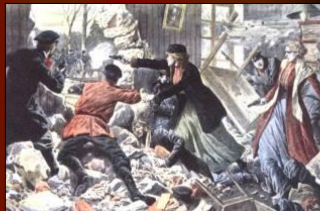
схема "Революция 1905-1907 года"

Разрозненность сил, отсутствие лидера, планов революции, стихийность, отсутствие поддержки восставших военными.