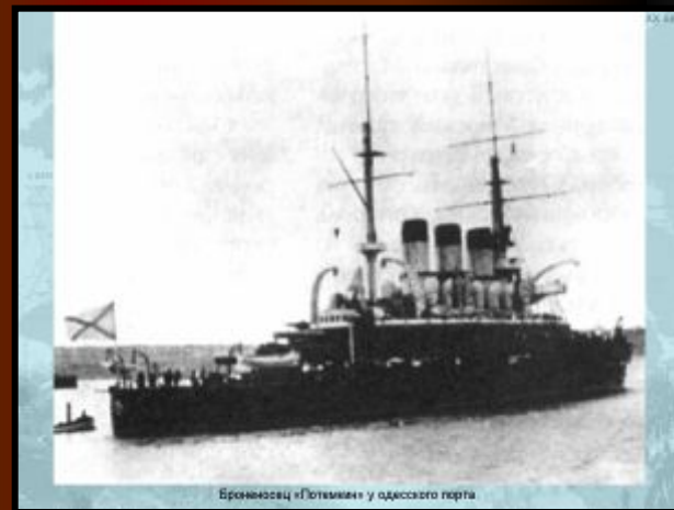
Броненосец «Потемкин» у одесского порта