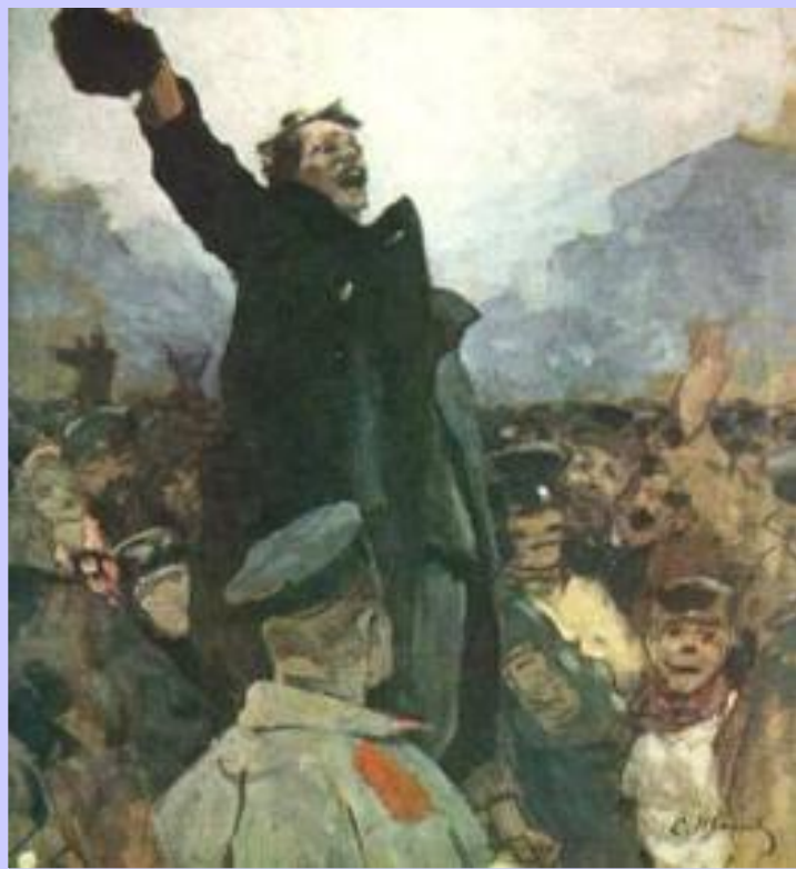
С.Иванов. 17 октября 1905 г. Митинг.

17 октября 1905 г. Николай II подписал манифест «Об усовершенствовании государственного устройства». Он вводил в стране политические свободы, провозглашал выборы в Государственную Думу, становившуюся законосовещательным органом.