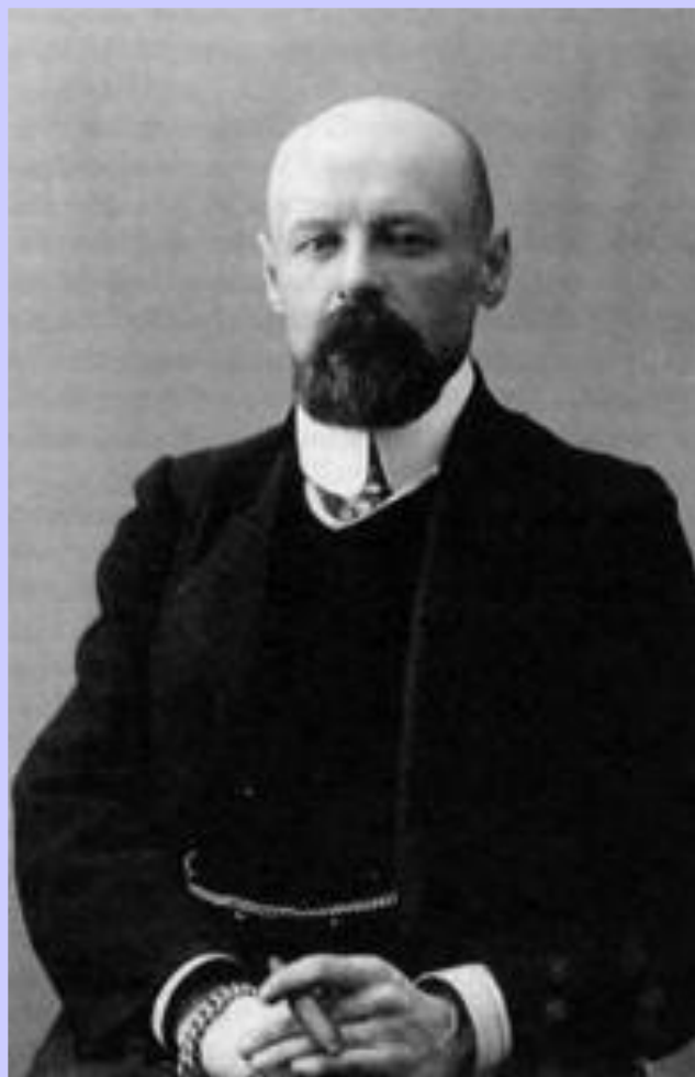
В.М.Пуришкевич- лидер черносотенцев.

В ходе революции организа- ционно оформились мона- рхические партии. Среди них выделялись Русское собрание, Монархическая партия, «Союз Русского народа». их лидеры высту- пали за восстановление в полном объеме самодержа- вия, православия и народ- ности. Русская народность провозглашалась господс- твующей во всех сферах жизни общества. Выдвигая тезис о «внешнем враге», монархисты начали анти- семитскую компанию