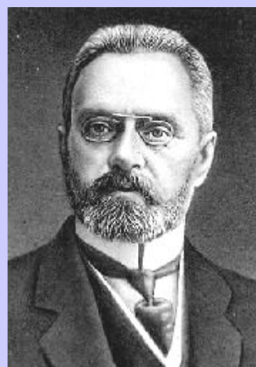
П.Н.Миллюков и А.И.Гучков

Кадеты опирались в основном на интеллигенцию. В это же время возник «Союз 17 октября» (А.И.Гучков). Октябристы добивались единства России, неприкосновенности частной собственности, уравнивания крестьян в правах с др. сословиями, наделение их участками за счет продажи государственных земель, ограничение стачек и введение рабочего законодательства. Октябристы опирались на крупную буржуазию и поме-