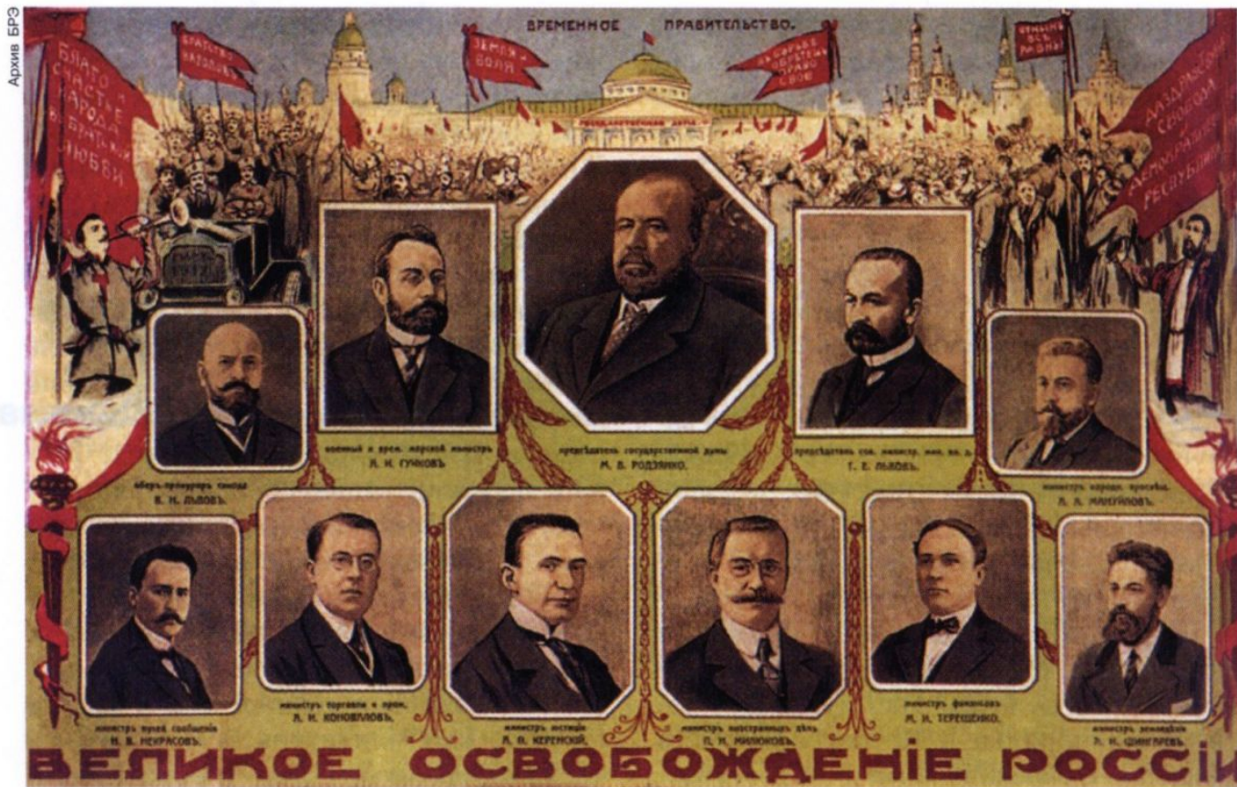
Первый состав Временного правительства. Агитационный плакат. Март 1917.