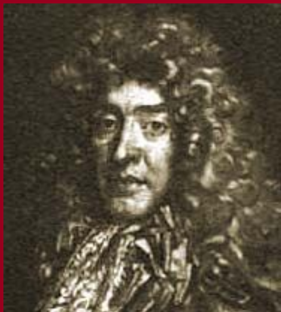
Яков 2 Стюарт