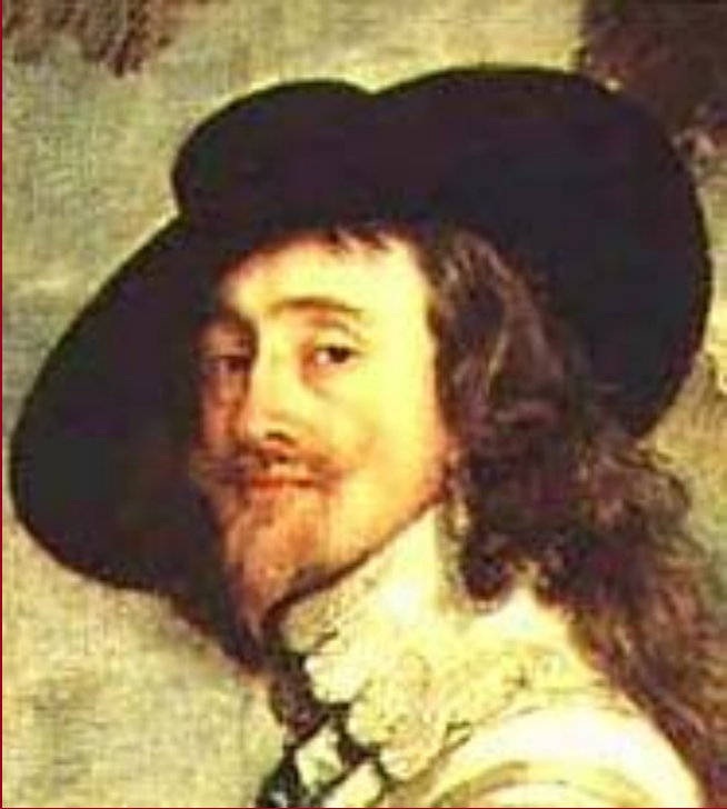
Карл Первый Стюарт