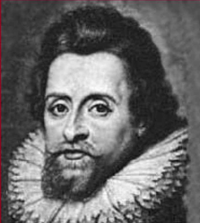
Яков Первый Стюарт