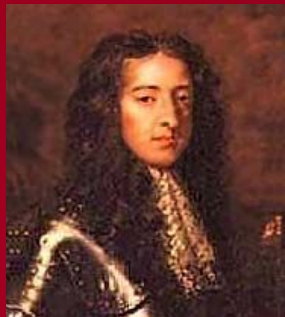
Вильгельм 3 Оранский