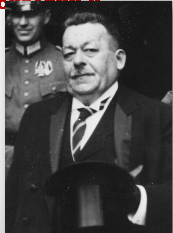
Фридрих Эберт, первый президент Веймарской республики