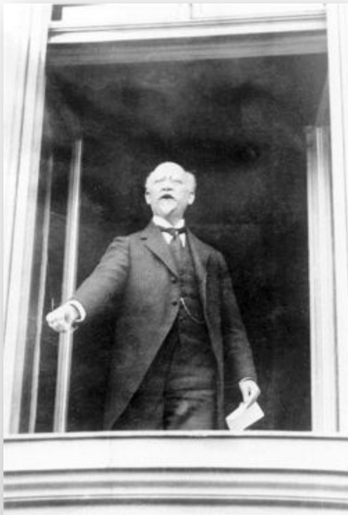
Филипп Шейдеман провозглашает республику 9 ноября 1918 г.

Введение всеобщего избирательного права Установление 8-часового рабочего дня Введение пособий по безработице