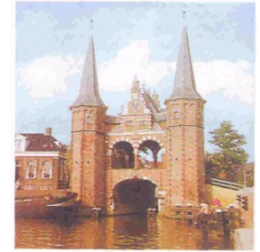
Нидерланды. Фризский озерный край

В Голландии была поговорка: «Бог создал море, а голландцы – берега». Как вы понимаете ее смысл