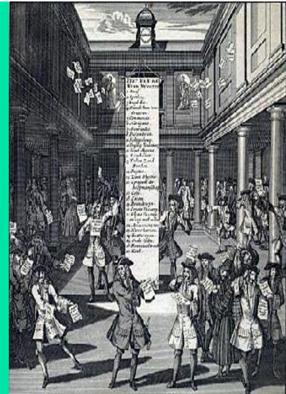
Спекуляция ценными бумагами на Амстердамской бирже Гравюра, 1720 год.