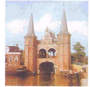
Нидерланды. Фризский озерный край

В Голландии была поговорка: «Бог создал море, а голландцы – берега». Как вы понимаете ее смысл