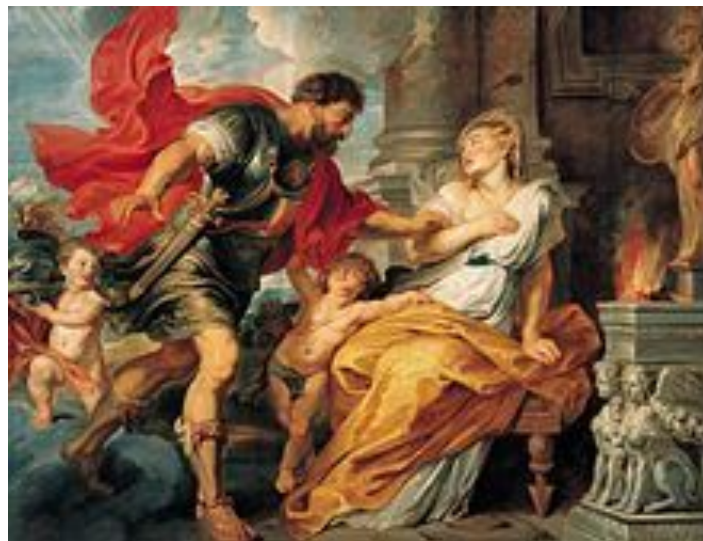
П.П.Рубенс «Бог войны Марс и Рея Сильвия»

Возникновение Римского государства Город Рим был вокруг поселений у брода через реку Тибр, на пересечении торговых путей. Согласно археологическим свидетельствам, Рим был основан как деревня, вероятно, в IX веке до н. э. двумя центрально-италийскими племенами, латинами и сабинянами (сабинами) на холмах Палатинском