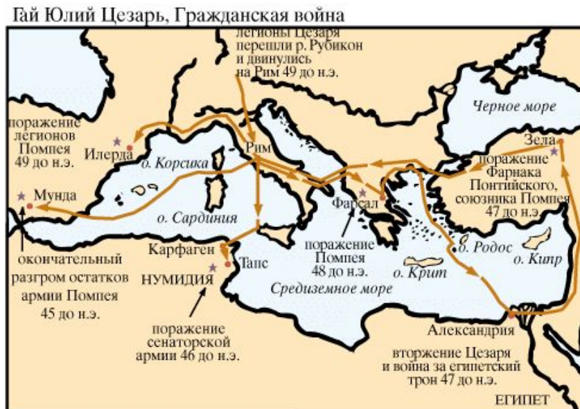
походы Цезаря в войне против Помпея