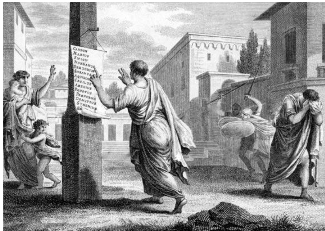
Чтение проскрипций в Риме