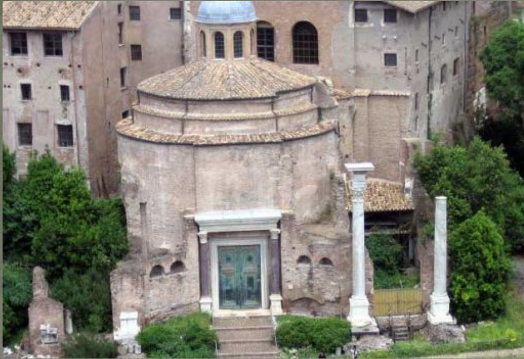
Христианская церковь на форуме Веспасиана, Рим.