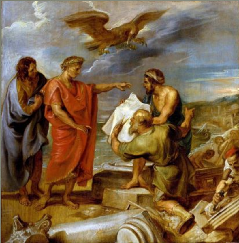
П. Рубенс. Основание Константинополя.

Причины перенесения столицы в Византий (Константинополь):