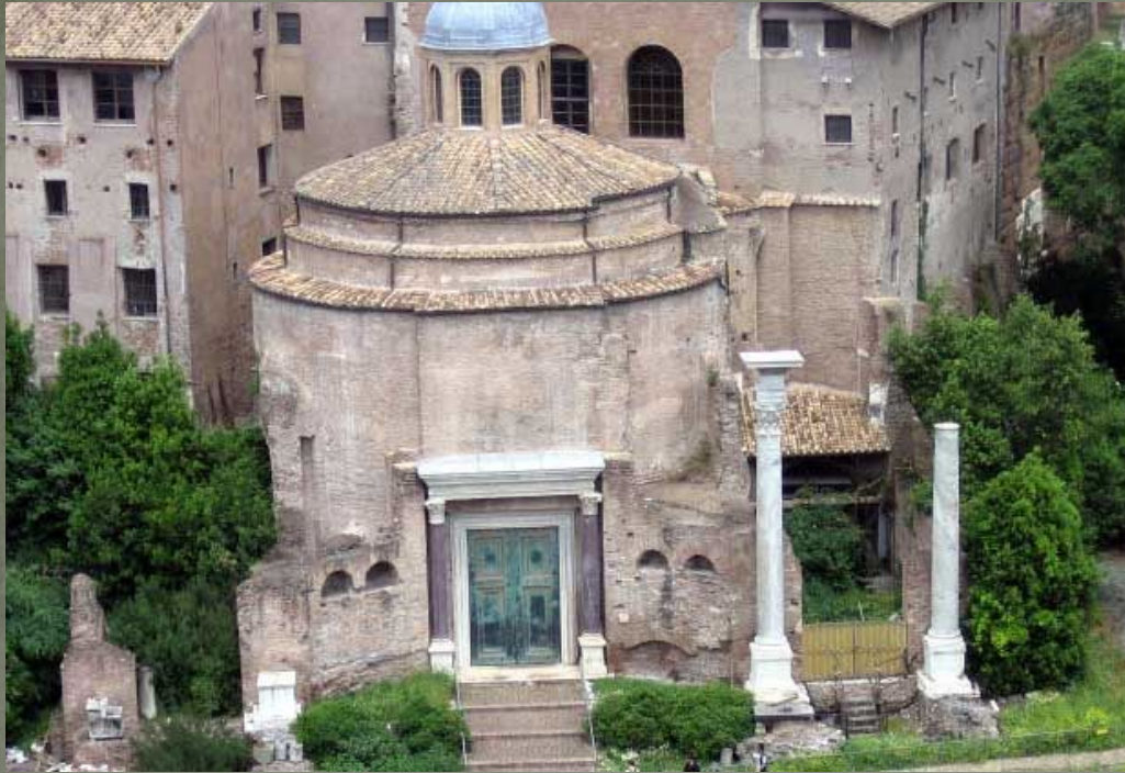
Христианская церковь на форуме Веспасиана, Рим.