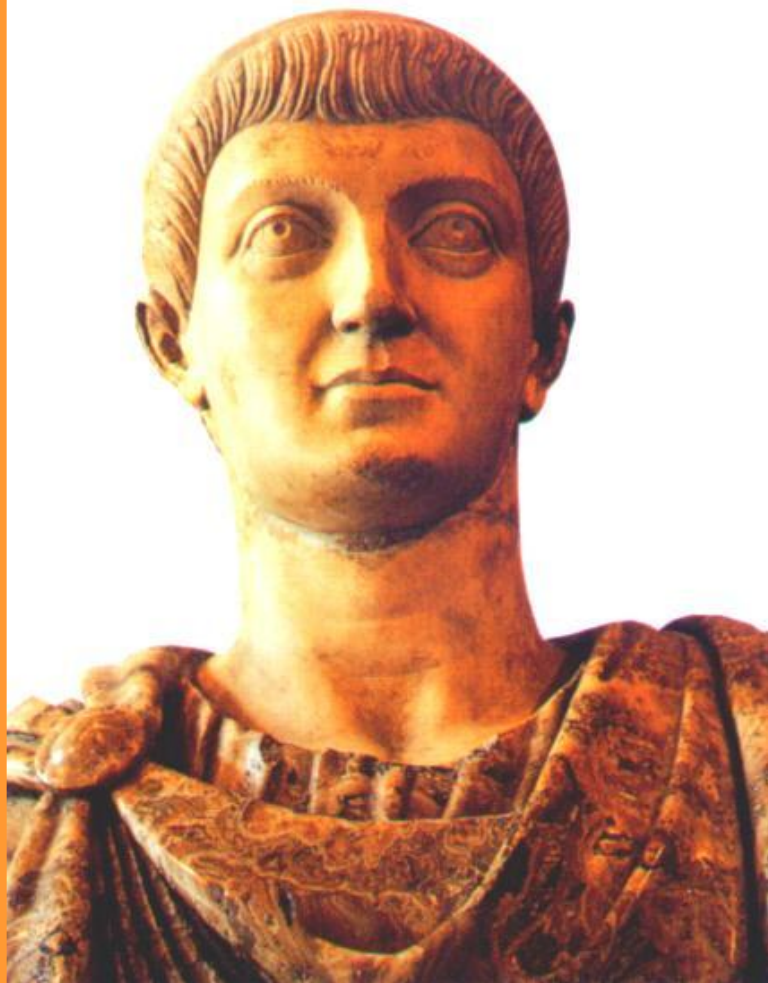
Император Константин Великий.

В н. 4 в.за императорский титул боролись несколько полководцев.