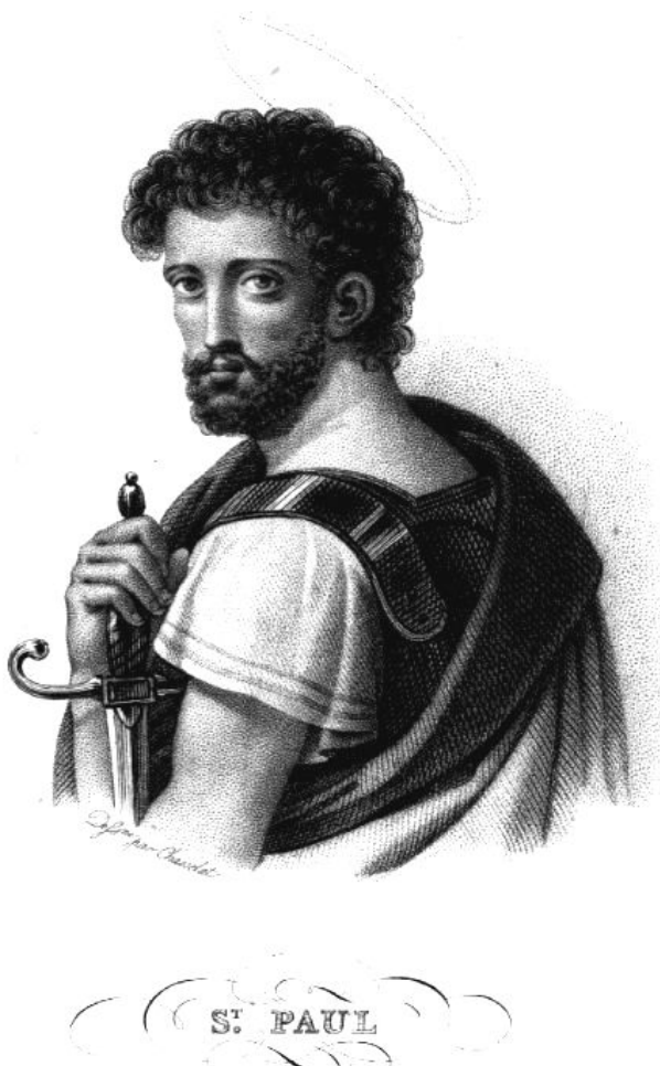
Апостол Павел. Гравюра 18 века.

В 325 году епископы договорились о создании единой организации-церкви.