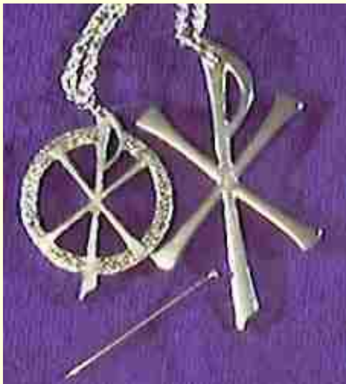
Первые символы христиан

В начале своего правления Константин был язычником. В 310 году после посещения священной рощи Аполлона, ему было видение бога солнца. По словам Константина, к нему во сне явился Христос, который повелел начертать на щитах и знамёнах своего войска греческие буквы ΧΡ, а на следующий день Константин увидел в небе видение креста.