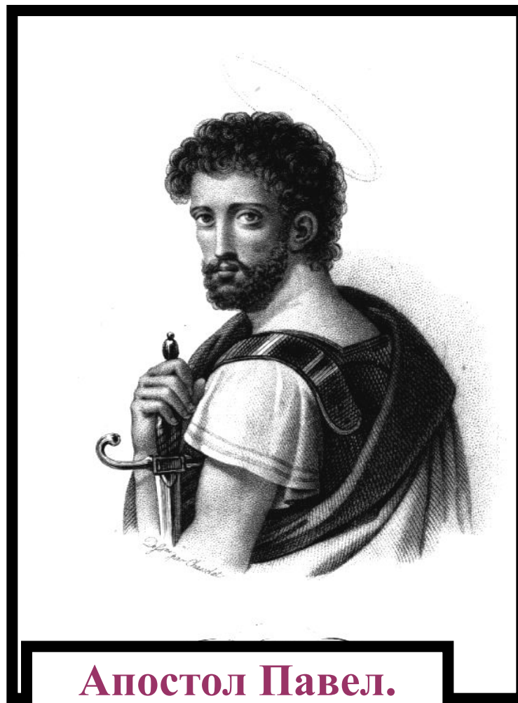
Апостол Павел. Гравюра 18 века.