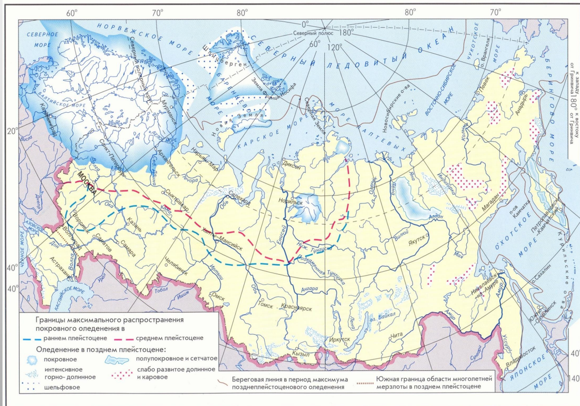
ОЛЕДЕНЕНИЯ ЧЕТВЕРТИЧНОГО ПЕРИОДА

100 тыс. лет назад – начало ледникового периода на земле