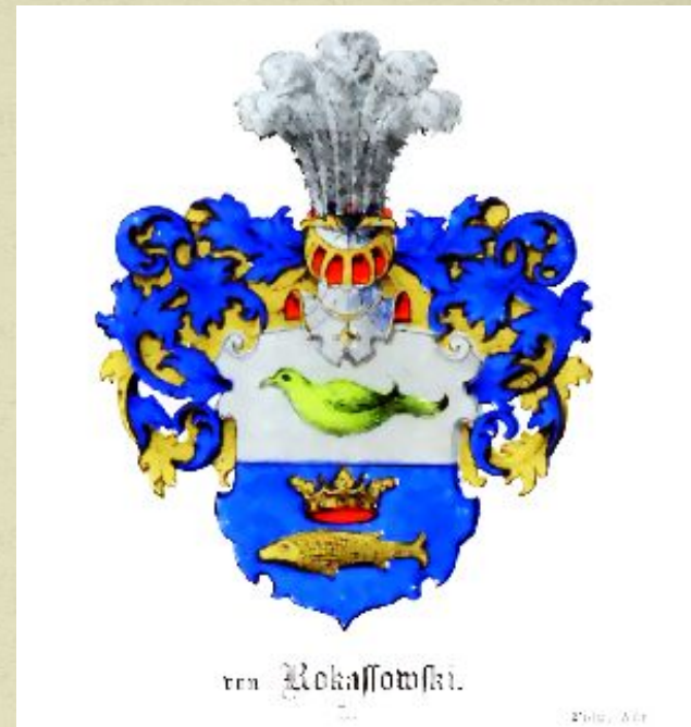
Герб рода Рокоссовских