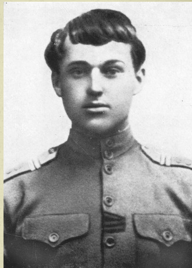
Драгун К. Рокоссовский. 1926 год.

«С самого раннего детства меня увлекали книги о войне, военных походах, битвах, смелых кавалерийских атаках... Моей мечтой было испытать все, о чем говорилось в книгах, самому»