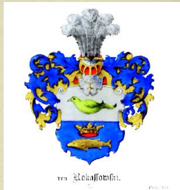
Герб рода Рокоссовских