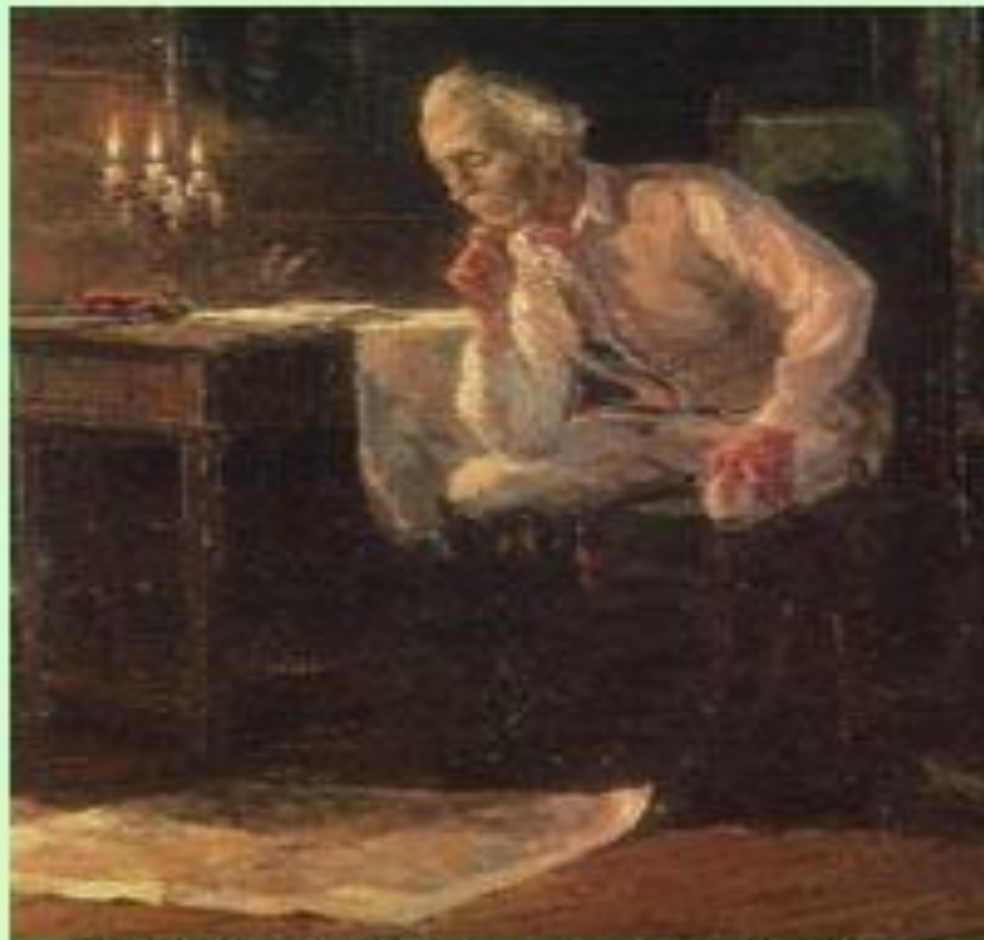
"А.В.Суворов в селе Кончанском". Художник Л.Вашля.