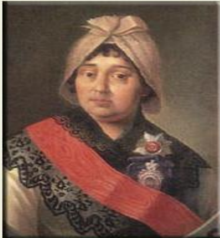
Варвара Ивановна Суворова (княжна Прозоровская) жена полководца