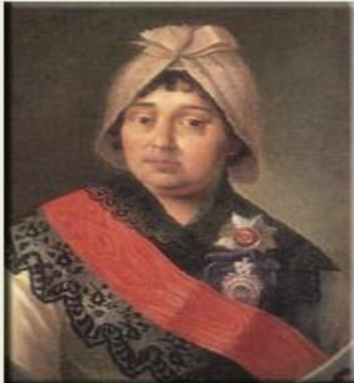
Варвара Ивановна Суворова (княжна Прозоровская) жена полководца