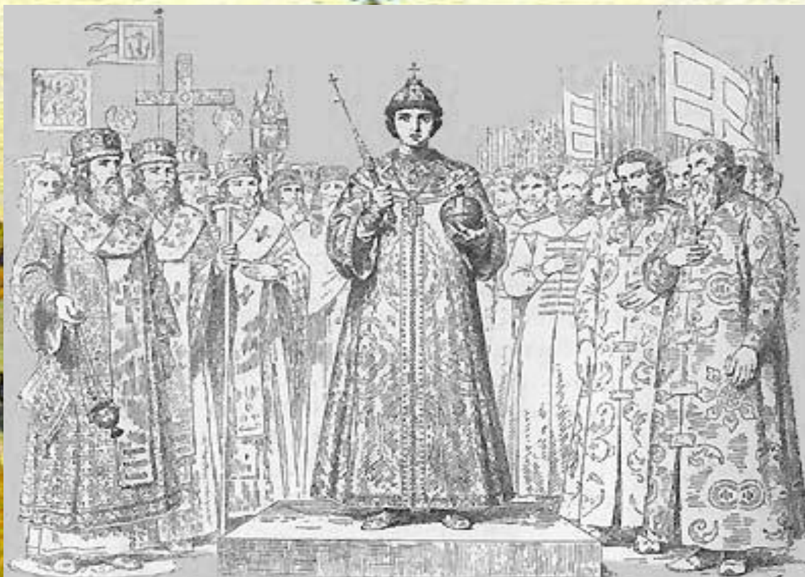
Царь Михаил Федорович

Родился 12 июля 1596 в Москве. Сын боярина Фёдора Никитича Романова, митрополита (позднее патриарха Филарета) и Ксении Ивановны Шестовой (позднее – инокия Марфа). Первые годы жил в Москве, в 1601 вместе с родителями подвергся опале Бориса Годунова, будучи племянником царю Федору Ивановичу. Жил в ссылке, с 1608 вернулся в Москву, где попал в плен к полякам, захватившим Кремль. В ноябре 1612, освобождённый ополчением Д. Пожарского и К.Минина, уехал в Кострому.