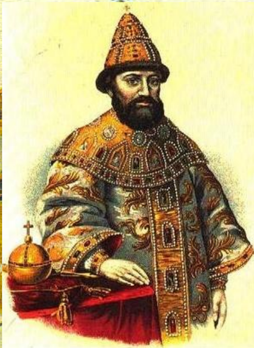
Романов Михаил Федорович - (1596–1645) – первый русский царь династии Романовых (1613–1917).