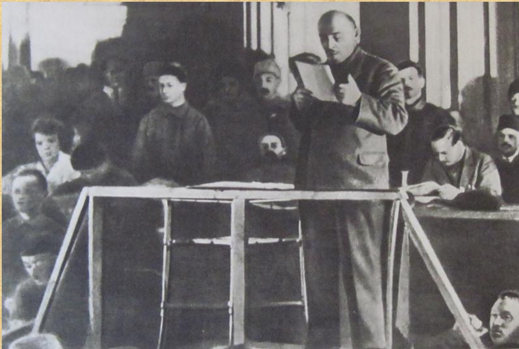
В.И. Ленин читает доклад о переходе к НЭПу на X съезде РКП (б)