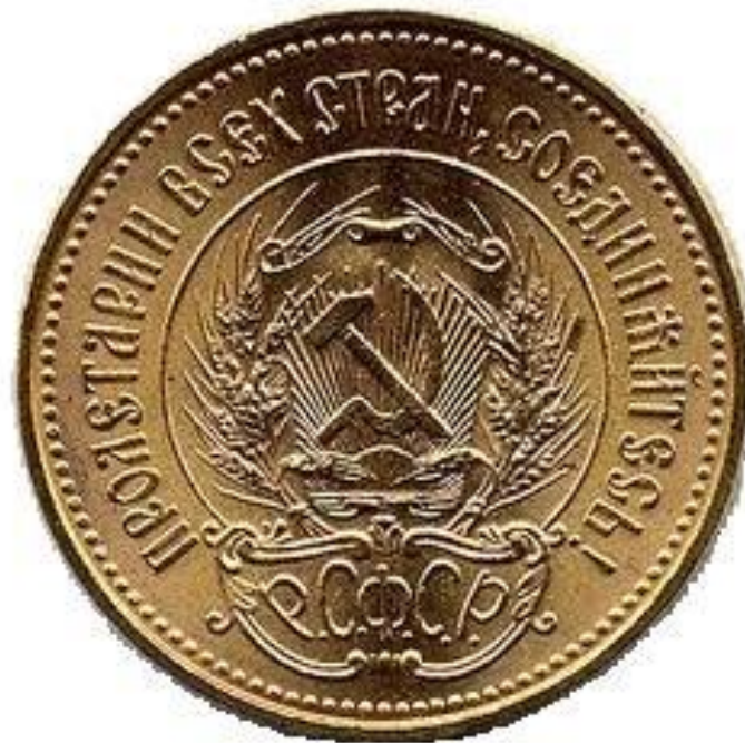
Советский золотой Червонец 1291-1927 годов