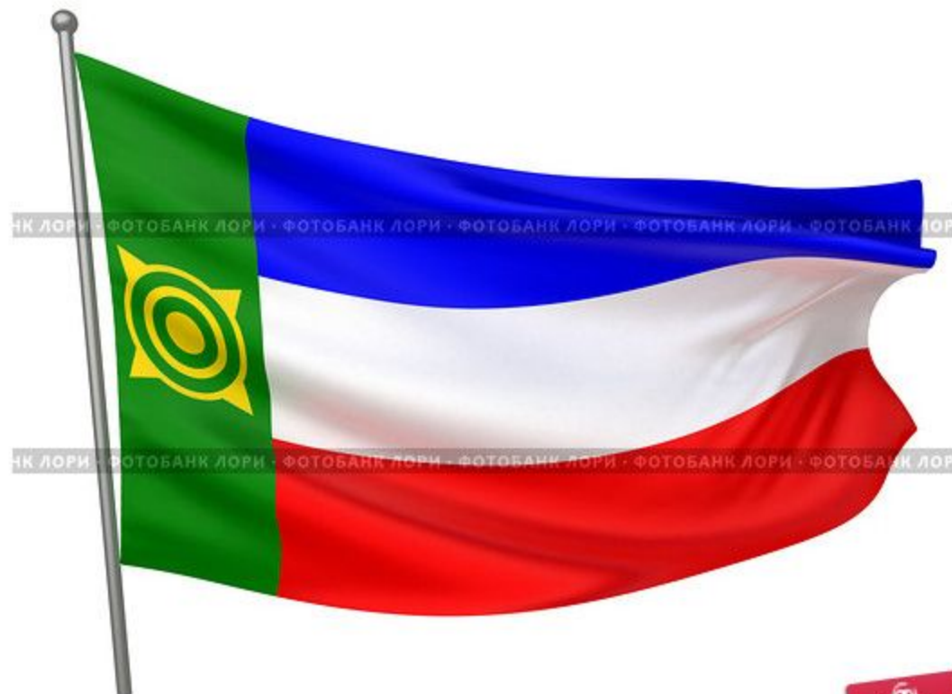
Хакасия Государственный флаг