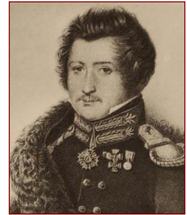
С.И.Муравьев - Апостол