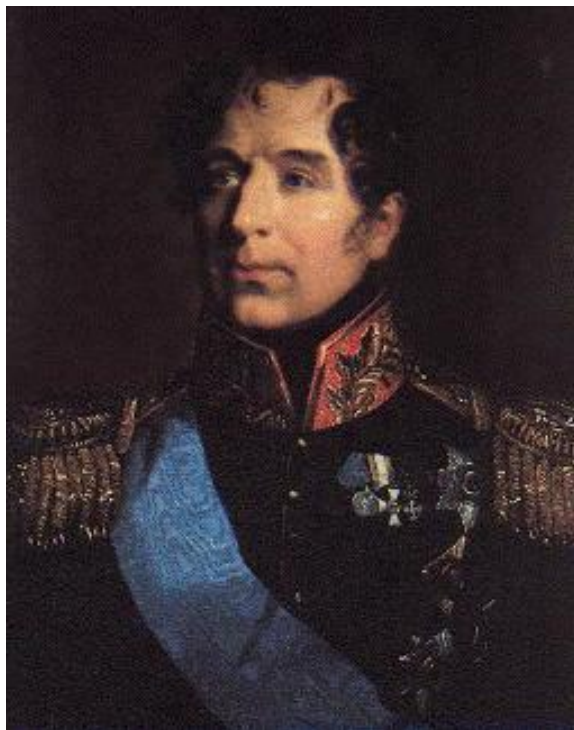
Генерал-губернатор Санкт - Петербурга М.А. Милорадович