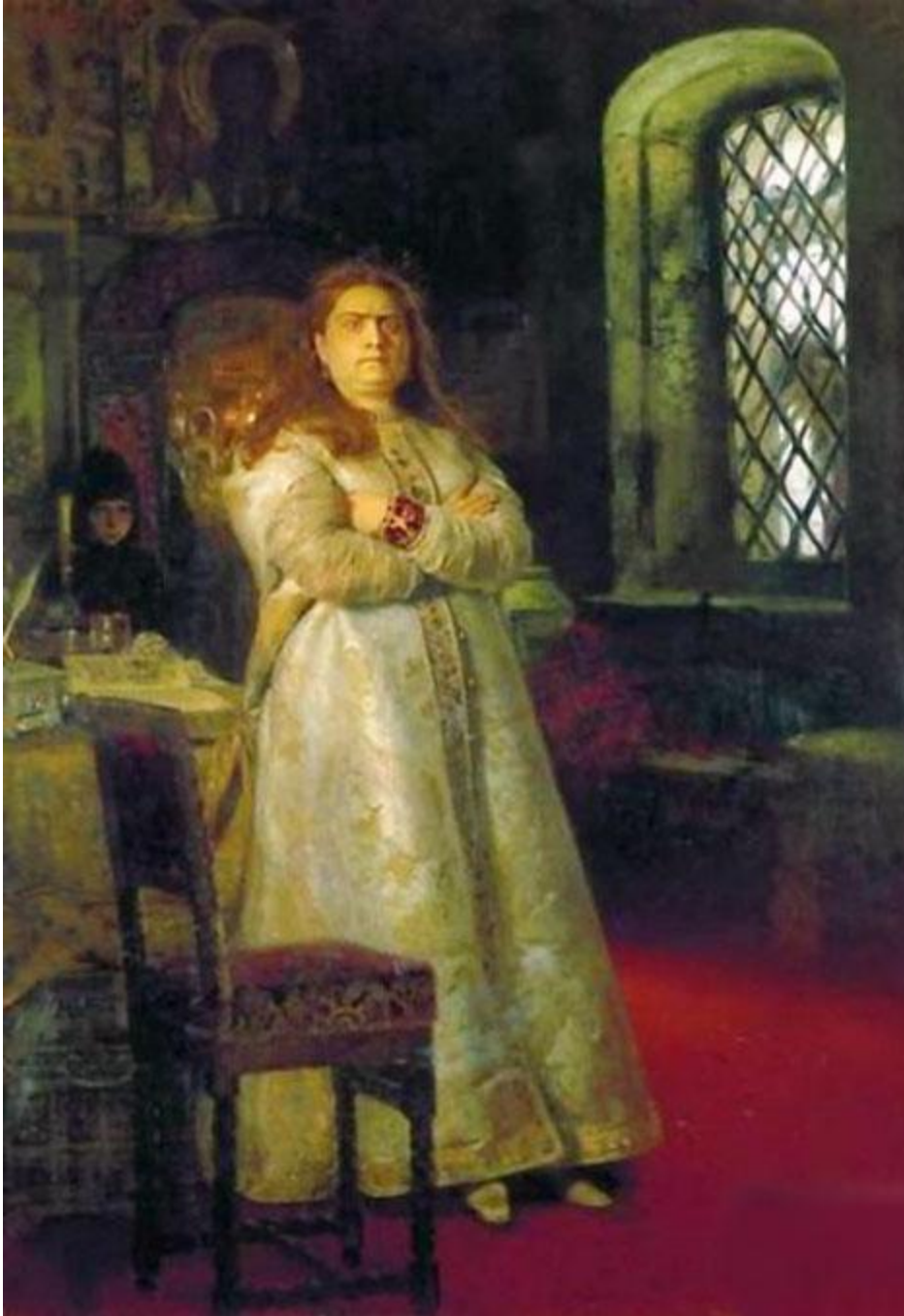
Царевна Софья в Новодевичьем монастыре. 1698 г.