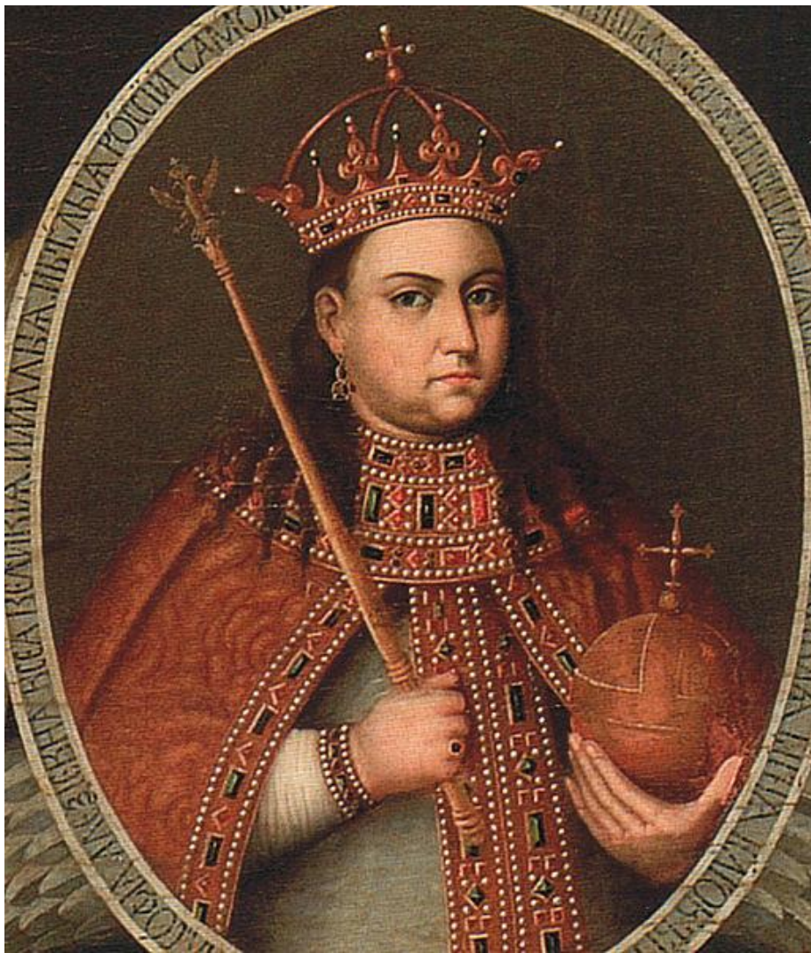
Софья, регент 1682-1689 (Голицын В.В.)