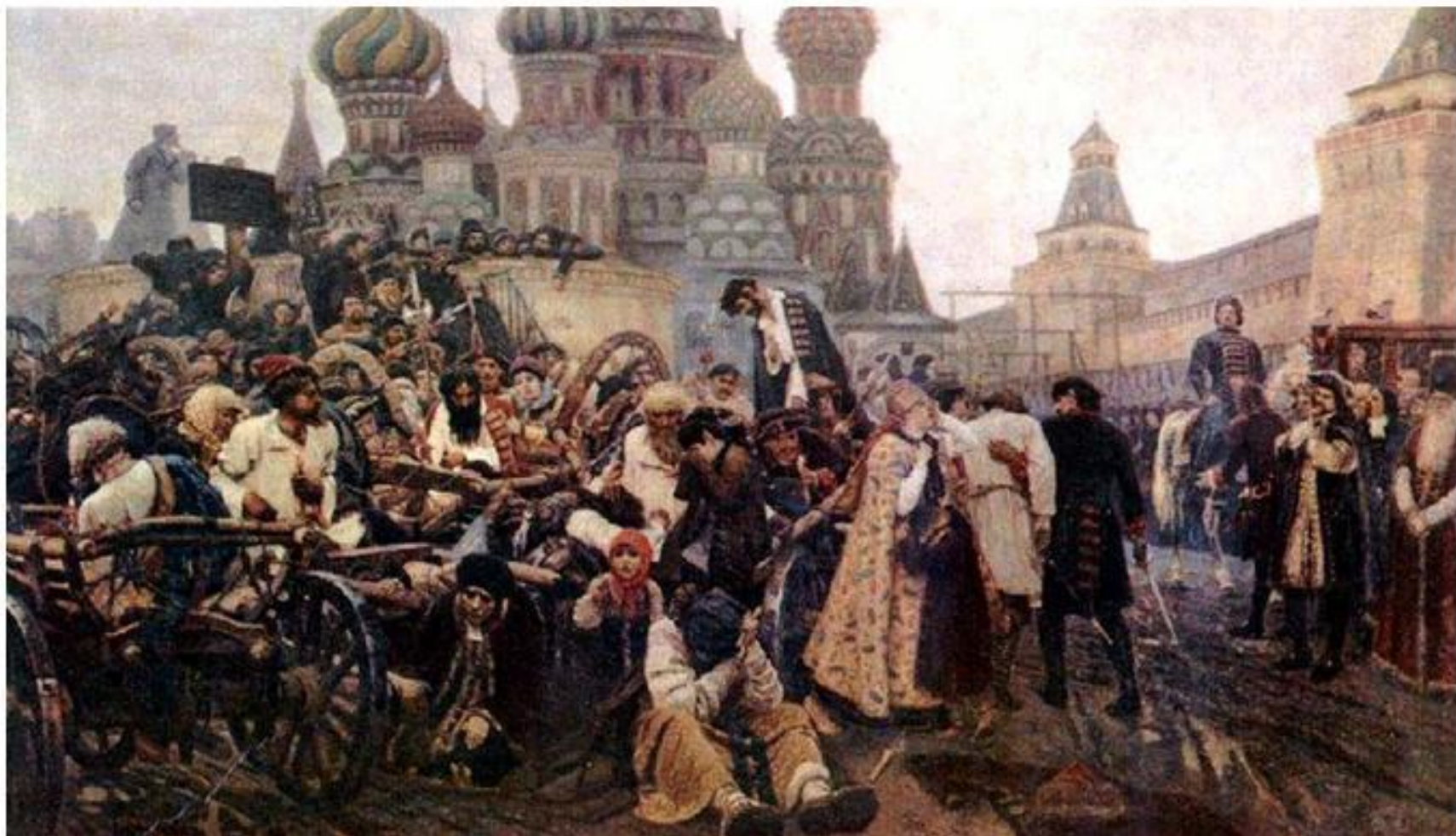
Утро стрелецкой казни