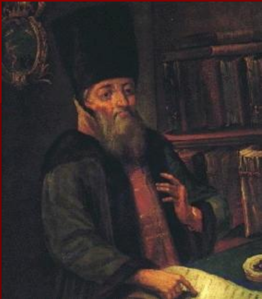
Ордин- Нащокин Афанасий Леонтьевич, дипломат. (ок.1605-1680)