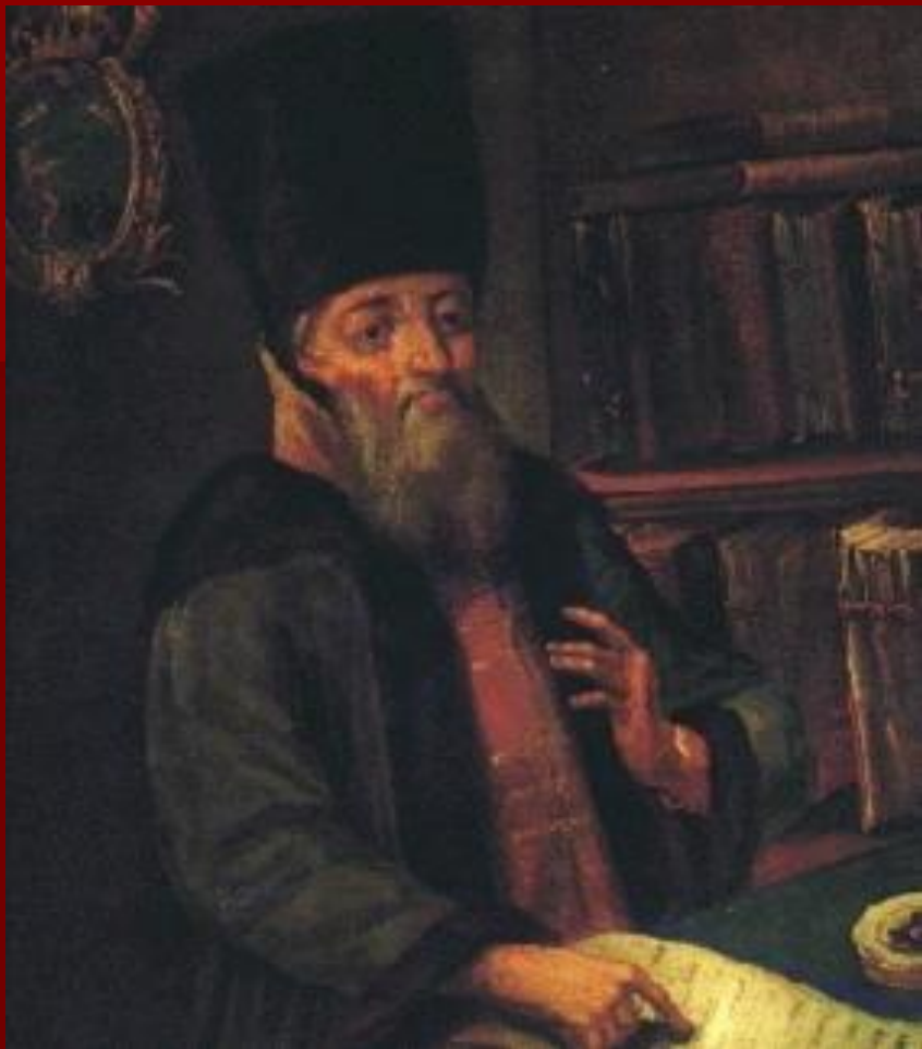
Ордин- Нащокин Афанасий Леонтьевич, дипломат. (ок.1605-1680)