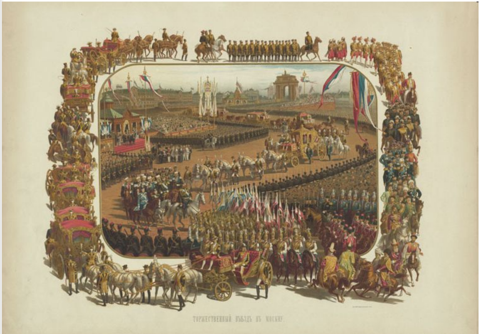
Въезд Александра III в Москву. Цветная литография с картины К. Савицкого