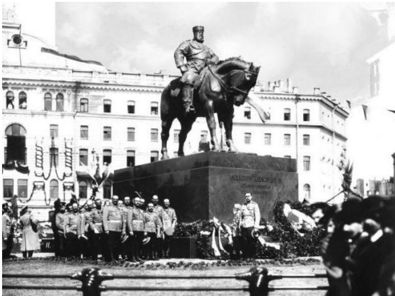
Открытие памятника Александру III 23 мая 1909 г. на Знаменской площади Санкт-Петербурга