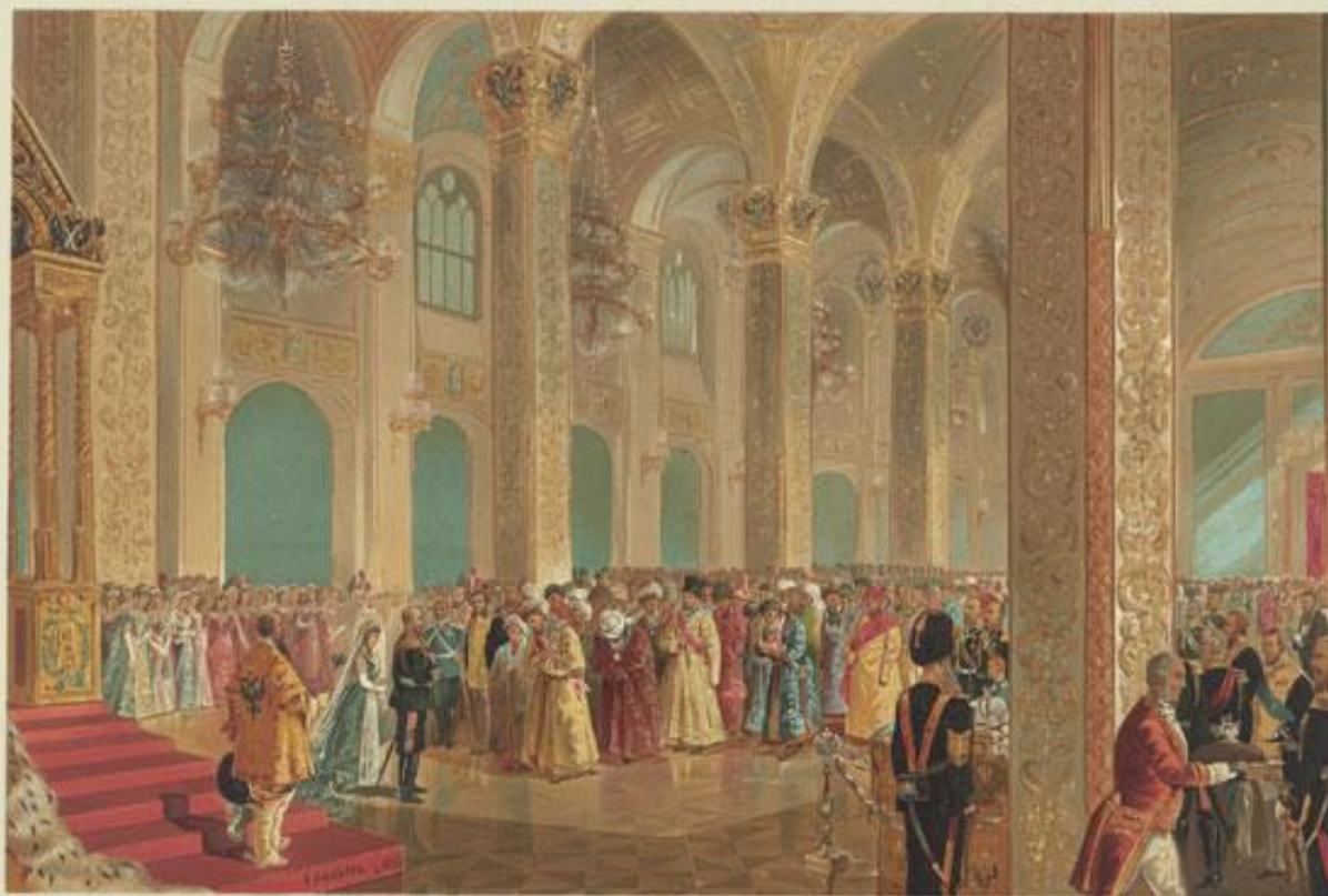
ГОСУДАРЬ ИМПЕРАТОРЪ ПРИНИМАЕТЪ ПОЗДРАВЛЕНІЯ ОТЪ ПРЕДСТАВИТЕЛЕЙ АЗІАТСКИХЪ НАРОДОВЪ.