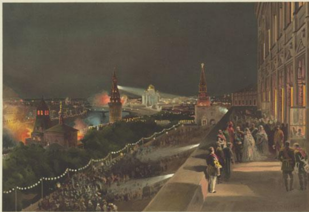
ПРАЗДНИКИ ВЪ КРЕМЛѢ.