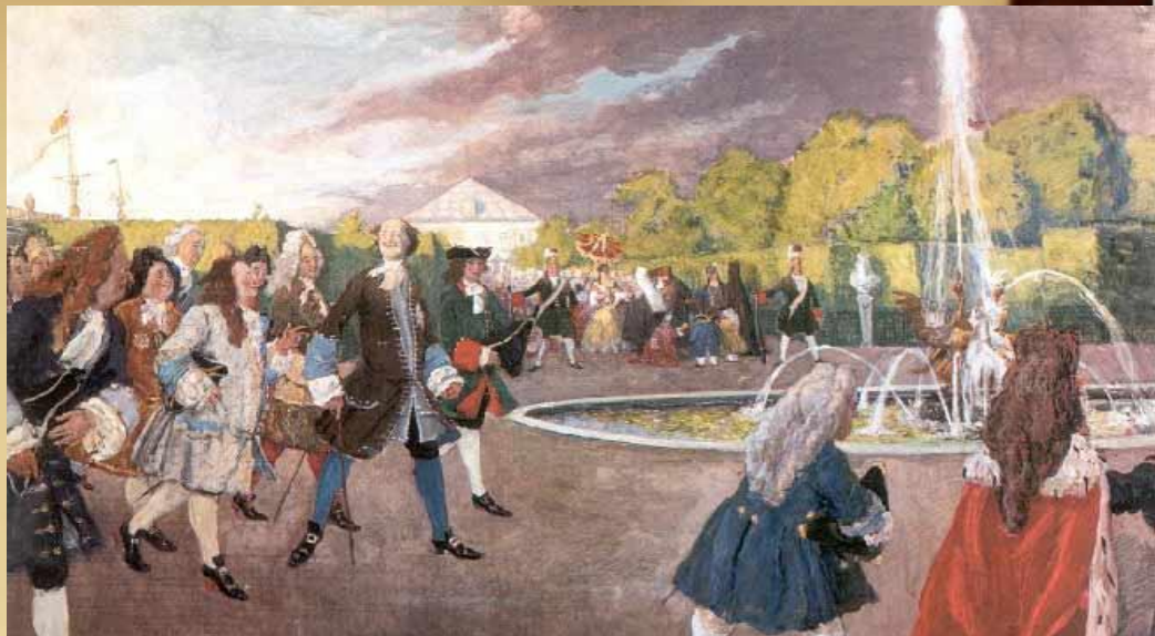
Петр I на прогулке в летнем саду