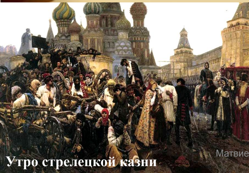
Утро стрелецкой казни