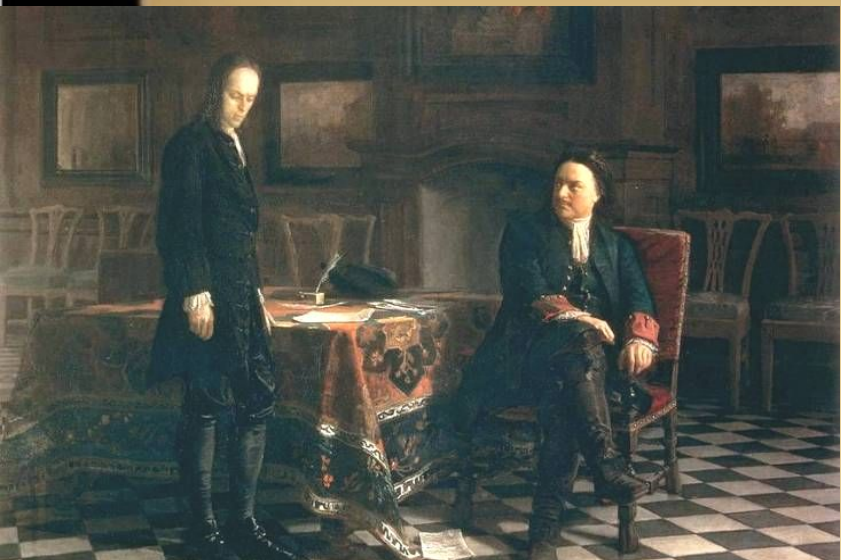
Петр I допрашивает царевича Алексея