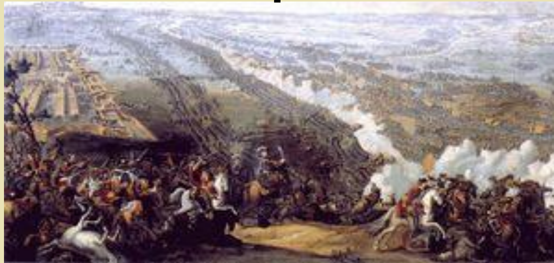
Школа №3 г. Дмитрова